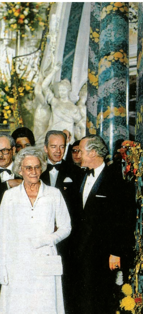
El president de l'SPD, Heinemann, al centre.