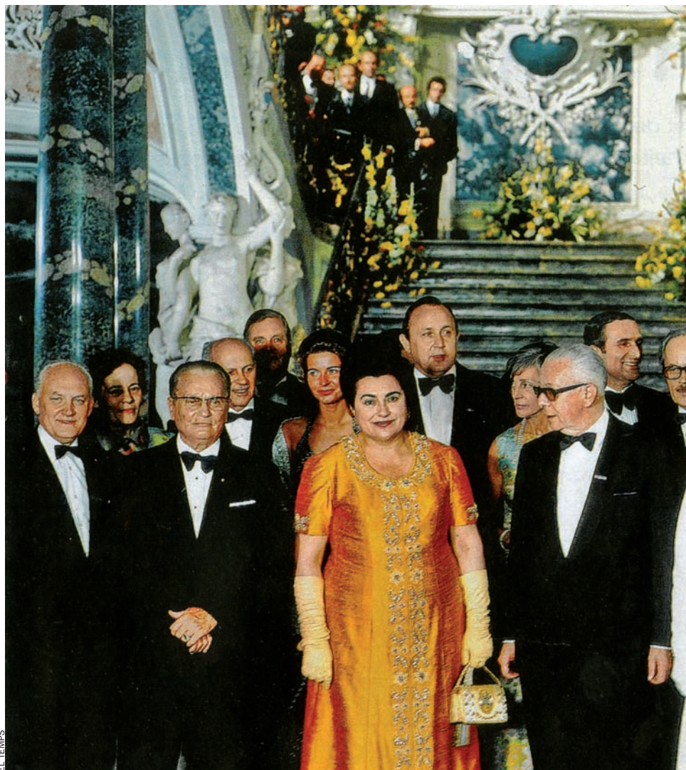
El president iugoslau Josip Broz Tito (segon per l'esquerra), en una recepció a Bonn el 1974.