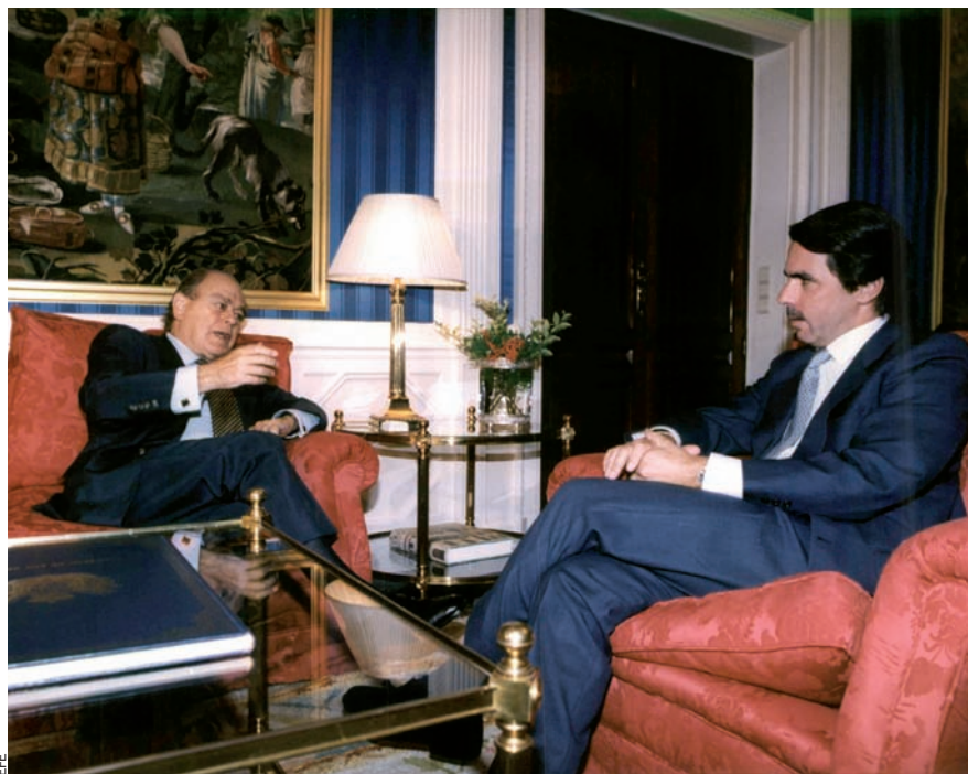
Jordi Pujol i José María Aznar, després de signar l'acord de governabilitat, l'any 1996.

Durant l'any 2009, d'una altra banda, l'independentisme social va experimentar un nou impuls, sobretot