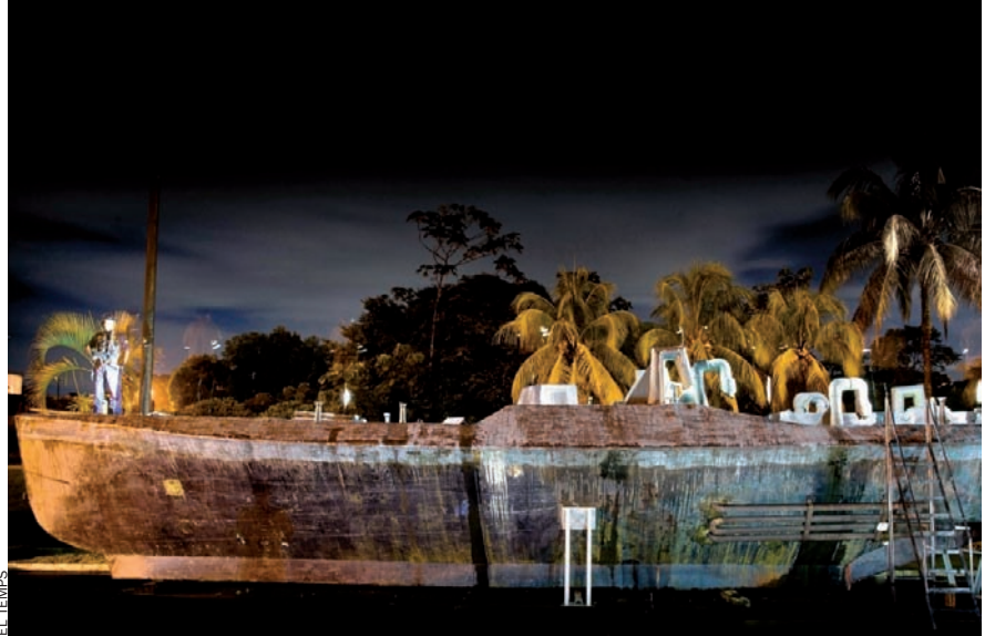
Submergible confiscat als narcotraficants, amarrat en una base naval de Colòmbia.