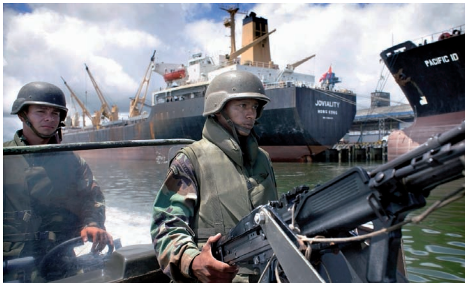
cidar”, diu. Patrulles militars colombianes al port de Buenaventura. A caçar contrabandistes amb xarxes d’acer i helicòpters.

només durant l’any passat. El transport de droga és extraordinàriament lucratiu: la construcció d’un submergible costa aproximadament mig milió de dòlars, mentre que el valor de mercat de la càrrega pot arribar a centuplicar aquesta xifra. Sovint, els narcotraficants enfonsen el bot una vegada efectuat el lliurament. Així doncs, hi deu haver dotzenes de bots d’un sol ús al fons marí, davant les costes de Mèxic.