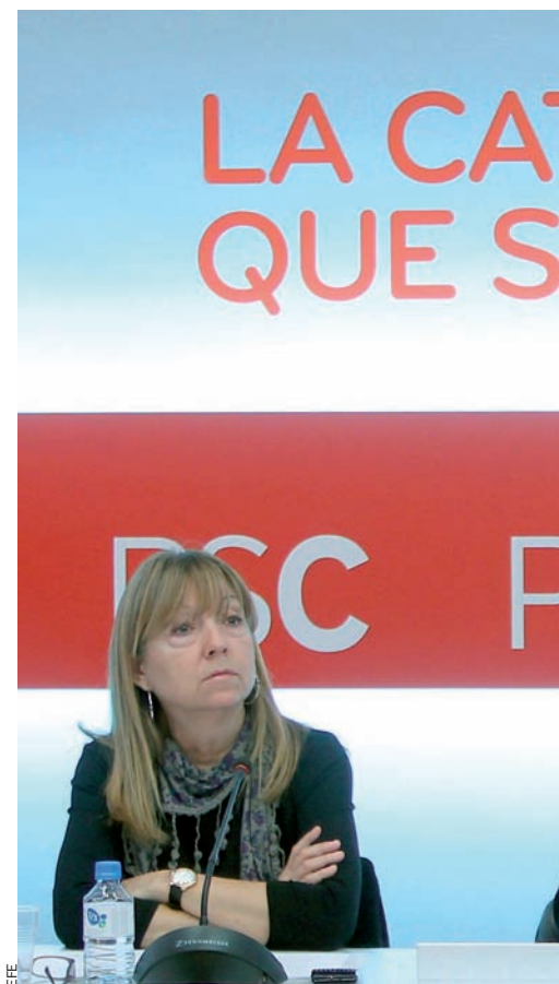
El president de la Generalitat i primer secretari del PSC, José Montilla, parla amb el presi-

corrents van viure unes tensions que finalment han acabat configurant el PSC actual, on costa de dibuixar, malgrat la tirada que hi tenen els mitjans de comunicació, una frontera clara entre allò que s'anomena el sector catalanista i el sector espanyolista. Nou Cicle és la plataforma que recull allò que se n'havia dit l'obioisme (el sector partidari del dirigent Raimon Obiols), que refusa de ser considerat com a integrant d'un sector catalanista de la formació. Al seu torn, molts dirigents dels socialistes catalans recorden que ha estat un president com José Montilla, provinent del Baix Llobregat, nascut a