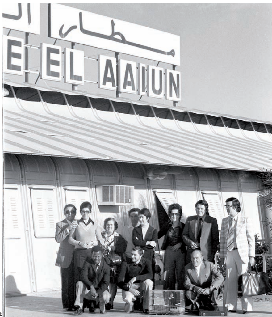
Un grup de civils espanyols a l'aeroport d'al-Aaiun, el 10 de desembre del 1975, preparats per a l'evacuació.

Segons algunes fonts, l' operació Oreneta preveia l'evacuació, en el conjunt del territori, de 10.500 civils, 4.000 tones de material i 1.350 vehicles. L'evacuació dels civils havia de ser prioritària, però, segons els testimonis,