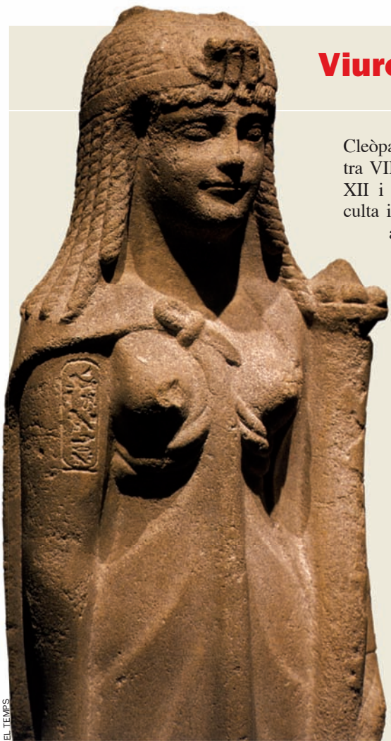
Una representació de Cleòpatra, en marbre, aguantant una cornucòpia.

Cleòpatra Filopator Nea Thea, Cleòpatra VII, fou la digna filla de Ptolemeu XII i Cleòpatra V Trifena, una dona culta i forta que va regnar durant vint anys i que va deixar a la història una empremta de fets i llegenda que dos mil·lennis no han pogut esborrar.