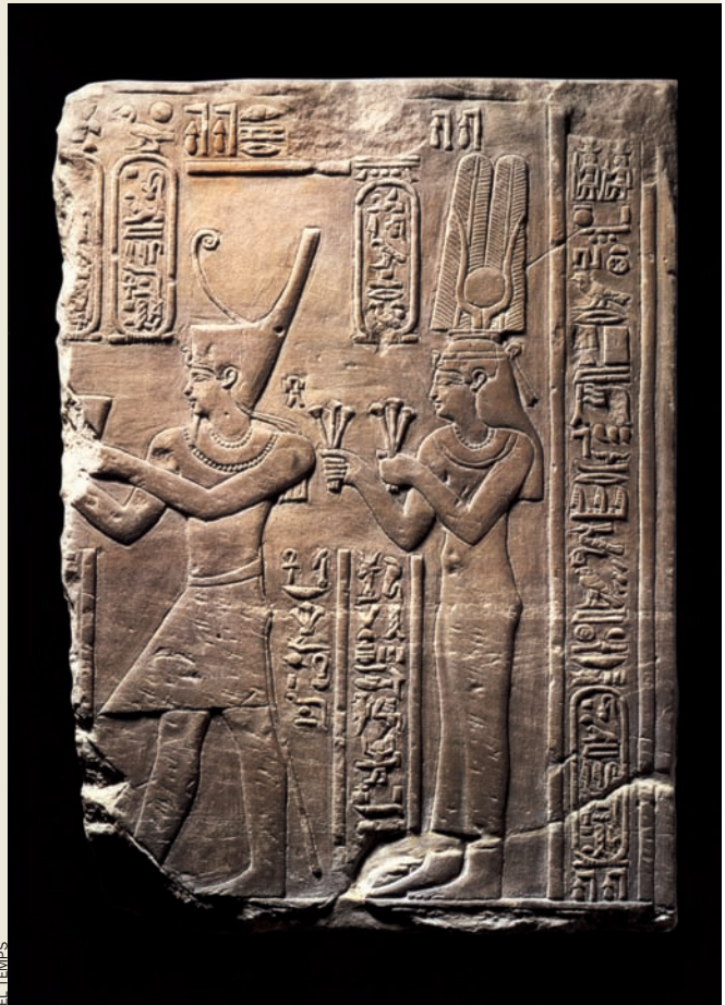
Els Ptolemeu van regnar durant gairebé 300 anys. A la imatge, Ptolemeu VIII, amb una de les seves dues mullers anomenades Cleòpatra.