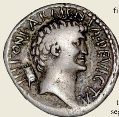
Representacions de Cleòpatra VII (esquerra) i Marc Antoni (dreta), en monedes de l'època.

la propaganda primera, fins arribar a la versió de la història que Hollywood ens va oferir els anys 60, i que sembla que ens hagi deixat gravada en la retina la cara i les corbes que hem volgut veure a la reina ptolemaica. Però ni la Cleòpatra de debò no tenia els ulls pintats d'Elizabeth Taylor ni el seu amant i marit no devia deambular amb el posat embriac que Richard Burton atorga a Marc Antoni i que, ves per on, casa perfectament amb la imatge que n'havia esbombat el cercle d'ideòlegs del seu rival polític, Octavi.