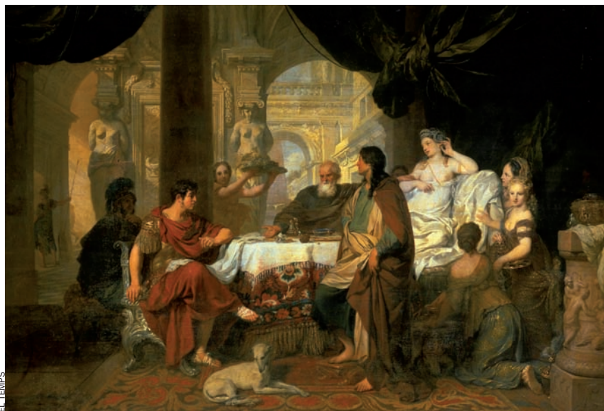
El banquet de Cleòpatra és un quadre de Gerard de Lairesse, del 1675: la faraona, davant de Marc Antoni, és a punt de treure's l'arracada de perla per dissoldre-la en vinagre i beure-se-la.

amb Juli Cèsar, Cleòpatra volia fundar un gran imperi oriental, amb capital a Alexandria.