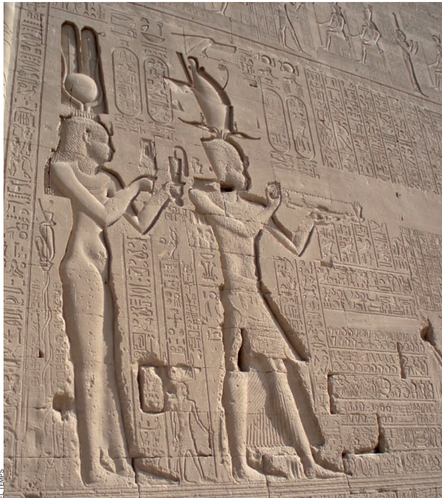
Cleòpatra VII amb el seu fill Cesarió, a les parets del temple de Dendera. El plançó de la reina i Juli Cèsar va ser finalment executat per ordre d'Octavi, futur emperador August.

Segons l'autora nord-americana, Octavi va establir la llegenda de la mossegada de cobra. D'aquesta mane-