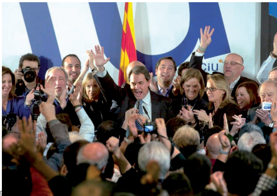
La victòria aclaparadora d'Artur Mas empeny cap a un atzucac el poder institucional del PSC als ajuntaments de l'àrea metropolitana i a les diputacions.

L a revolució taronja ha vençut el cinturó roig. Els 62 diputats de CiU representen quelcom més que una majoria folgada que permet de governar sense lligams ni hipoteques d'aquelles que després es paguen a interessos que freguen la usura. És el trencament d'un dic de contenció que històricament se sabia fort com un roure, indestructible per a cap altre partit que no es definís com a progressista i d'esquerres.