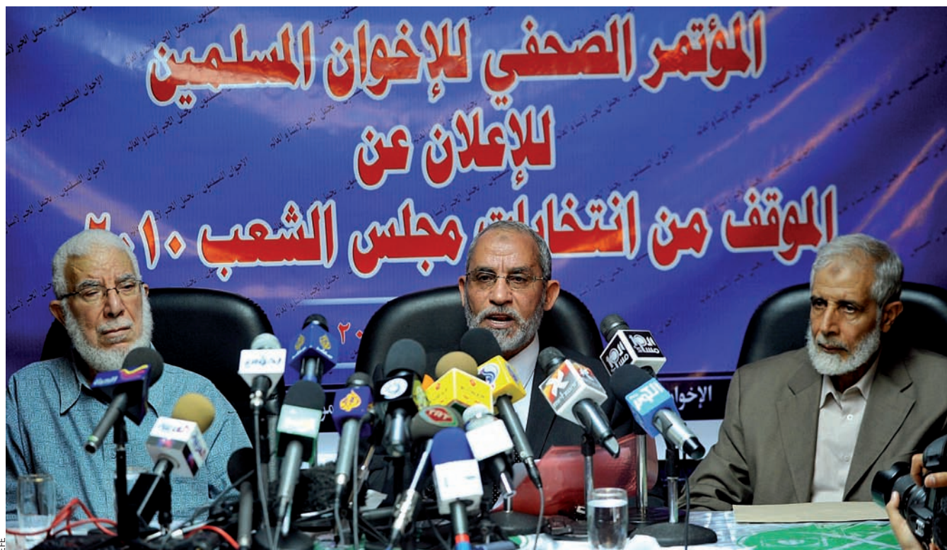
El mes passat, al Caire, el líder dels Germans Musulmans, Mohamed Badie, al centre, anunciava que la seva organització participaria a les eleccions del 28 de novembre.

pretació més moderada que en alguns països musulmans, com pot ser, per exemple, l'Iran.