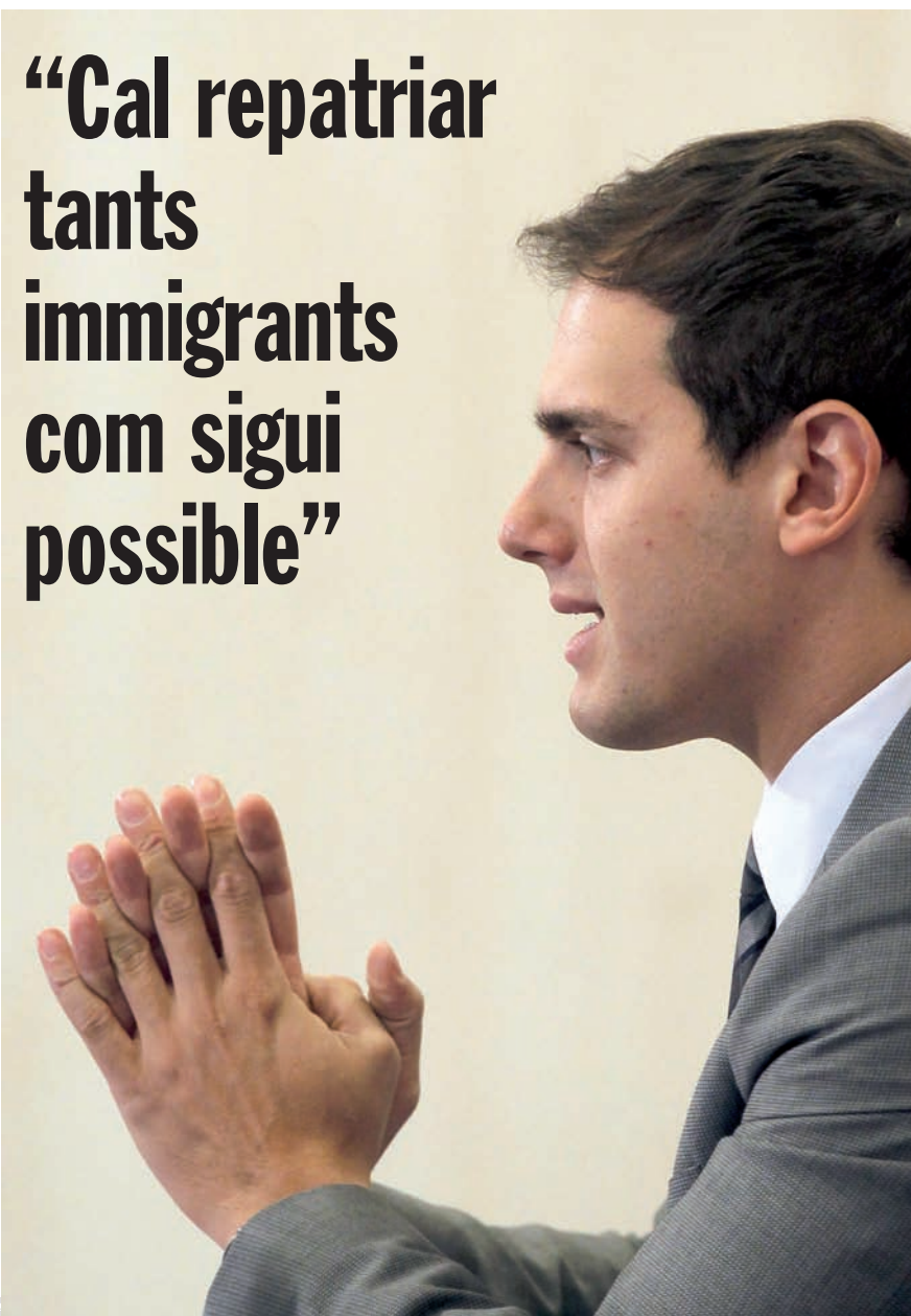
Albert Rivera, candidat de Ciutadans

U n dels principals reptes del país és sortir de la crisi econòmica. En aquest sentit, penseu que cal modificar el model de finançament català actual? I si és així, en quina direcció? Defenseu un sistema de concert econòmic?