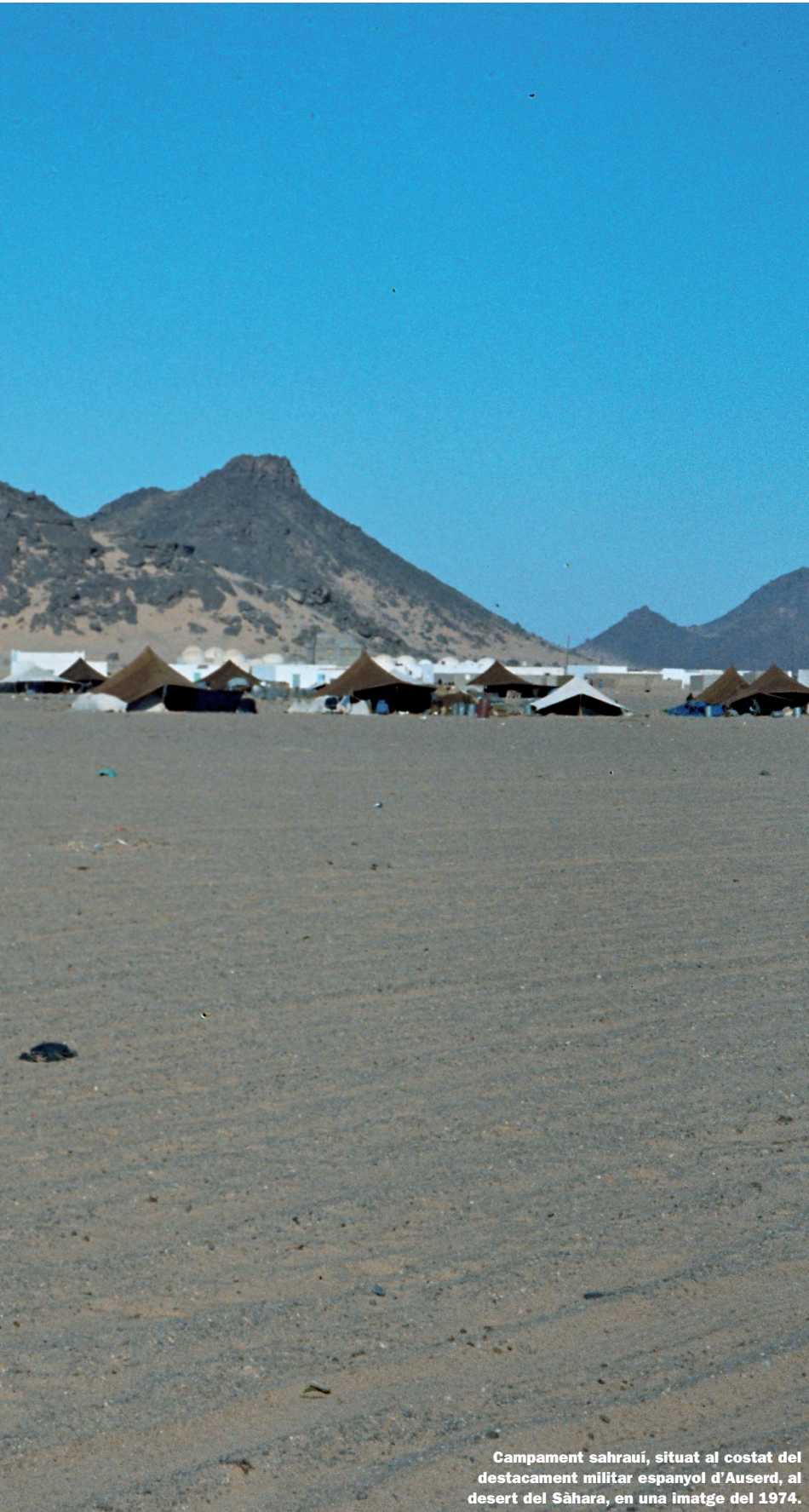
Campament sahrauí, situat al costat del destacament militar espanyol d'Auserd, al desert del Sàhara, en una imatge del 1974.