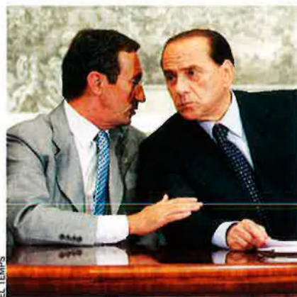
Fini vol la dimissió de Berlusconi.

Berlusconi s'enfonsa. S'ensorra la Casa dels Gladiadors a Pompeia i s'enfonsen consensos a la ja desarticulada arena política italiana. Amb les amenaces de Gianfranco Fini a Silvio Berlusconi, renyant-lo i demanant-li directament la dimissió, s'eri-