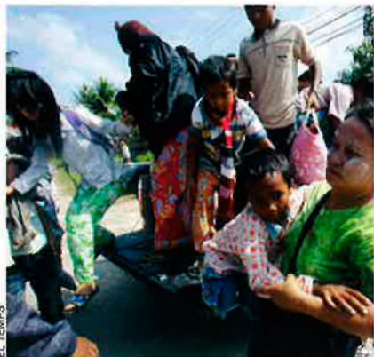
Els karenes fugen de Myanmar.