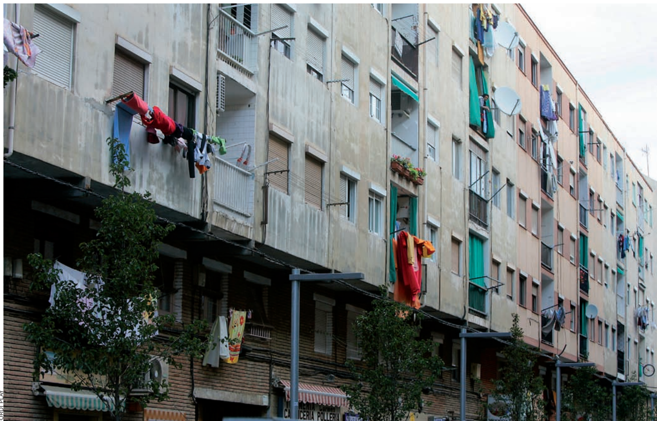
Els barris que es van crear amb l'arribada de la immigració dels anys 60 i 70 són els que han rebut, principalment, els ciutadans provinents de les noves onades migratòries extracomunitàries. És en aquests barris on el discurs del PP ha fet més forat.