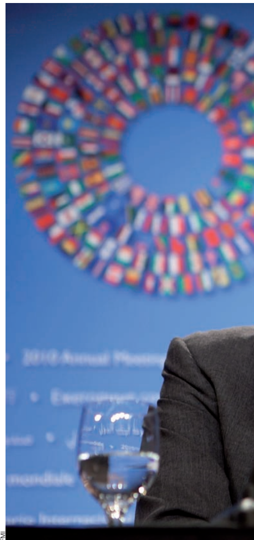
El nord-americà John Lipsky, el segon home