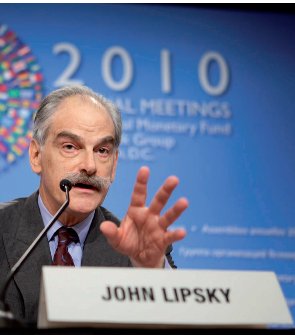
més poderós del Fons Monetari Internacional, primer director en funcions.

oficines menudes, unes tres o quatre persones per país. Si Islàndia fa fallida perquè és insolvent pot sol·licitar un préstec, una moneda forta, una taxa d'interès subvencionat de vegades del 5%, i tot ha d'anar de pressa. L'equip de camp, com és anomenat, envia els informes, un altre equip a Washington escriu un pla de rescat, Islàndia confirma el pla de rescat; llavors el Consell de Governadors de l'FMI delibera i decideix que el pla funcionarà. Aleshores, només prement un botó, 168 milions de dòlars comencen un viatge que acaba pocs segons després a Reykjavík. Aquest fet diferencia les resolucions de l'FMI de moltes altres resolucions multilaterals: els diners flueixen d'immediat.