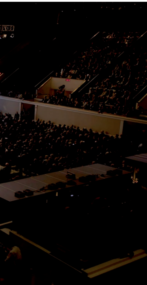
Mundial, a Washington.

amb crèdits. Per què els negocis poden disposar de més diners dels que tenen? “No ho sé”, diu Rogoff, “no hi ha cap motiu raonable”. Es podrien crear institucions de supervisió noves, que haurien de poder aplicar sancions dràstiques.