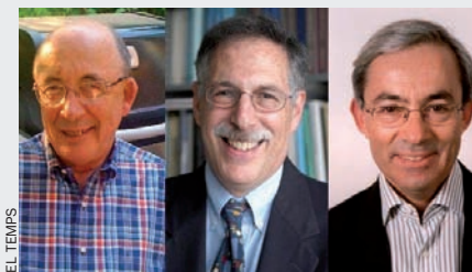
Els tres guardonats amb el premi Nobel d’economia el 2010 per un treball sobre desocupació.

Dos nord-americans i un xipriota comparteixen el premi Nobel d’economia 2010. Els guardonats són els professors Peter Diamond, Dale T. Mortensen i el britànic d’origen xipriota Christopher Pissarides, per haver elaborat una teoria “entenedora” i “coherent” que estudia els efectes negatius de la desocupació. L’acadèmia ha valorat la feina en els anomenats mercats de cerca , com ara el mercat laboral, on s’ha de dedicar temps i recursos econòmics per trobar feina i on es produeixen “friccions”. Les friccions es tradueixen en treballadors des-