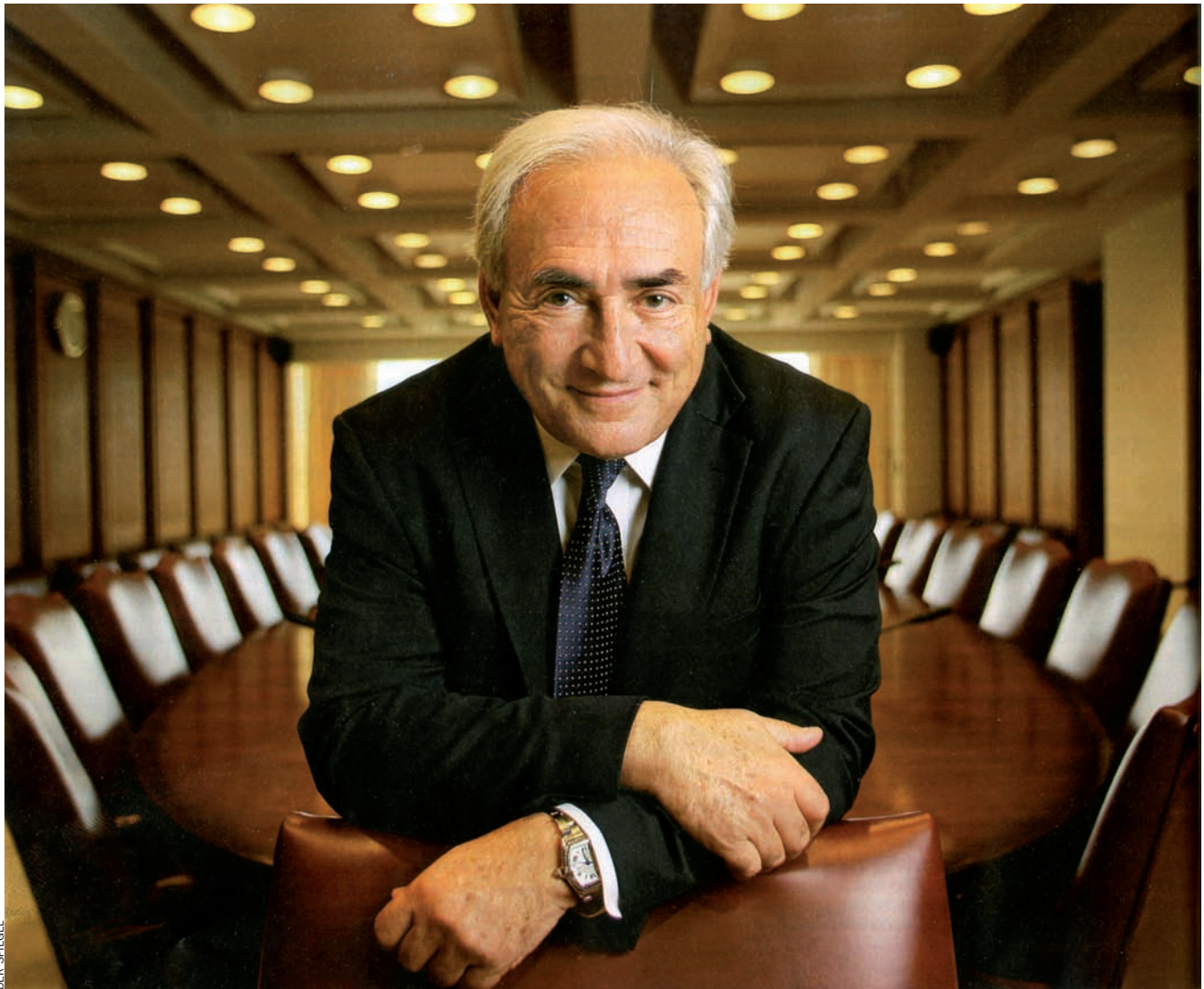
El director de l'FMI, Dominique Strauss-Kahn: "Els diners són la medecina, però el pacient ha de canviar de vida."

l'excepció d'un professor de Boston, gairebé ningú no el contradia.