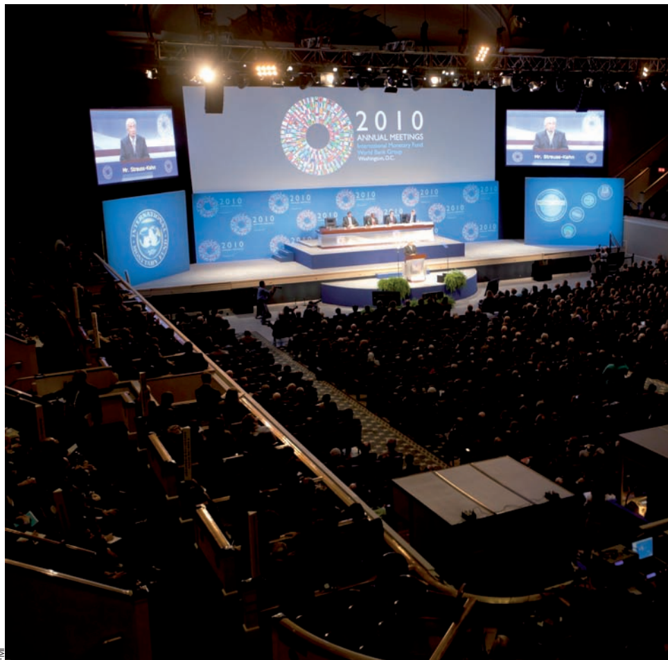
El propassat 8 d'octubre, Dominique Strauss-Kahn obria la trobada organitzada per l'FMI i el Banc

Rogoff i Reinhart mostren que el cas Lehman era una síndrome de la gran recessió des dels anys 30, que s'alimentava de molts factors. Sobretot indiquen que les crisis financeres com l'actual sempre acaben en crisis d'endeutament dels estats, independentment de quines mesures prenguen els governs. La desocupació i els rescats financers permeten que els dèficits públics es disparen, cosa que atrau els programes d'estalvi desesperats, que porten a una nova recessió. Aquest és el cercle viciós que ocorre ara mateix i que Rogoff i Reinhart ja havien descrit abans de la fallida de Grècia. Si hom