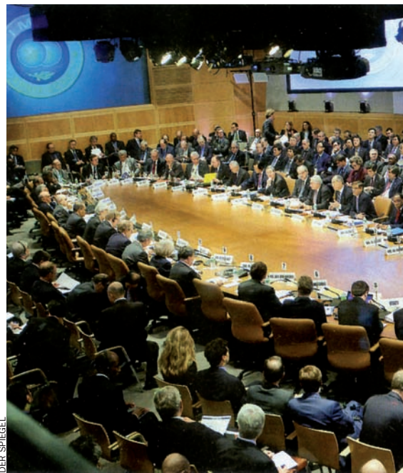
Congrés de l’FMI a Washington a l’abril. L’objectiu final: la pau mundial a través de l’estabilitat econòmica.