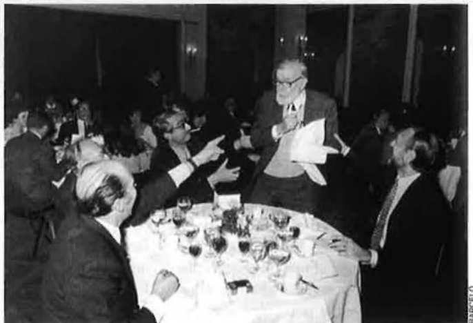
1 Un jove Triadú fa classe de català d'estiu a Cantonigròs. 2 El grup d' Ariel . A l'esquerra de Triadú, Jordi Sarsanedas. Drets, Alexandre Cirici, Rosa Leveroni, Josep Romeu, Frederic-Pau Verrié i Joan Perucho. 3 Inauguració del monument a La plaça del Diamant, a Gràcia, l'any 1980. Joan Triadú apareix darrere de Mercè Rodoreda. 4 Joan Oliver fa broma amb el jurat del premi Sant Jordi 1989: Domènec Guansé, Joan Fuster i Josep M. Castellet.

blava forçat, el rebia i es mirava allò que portava a la carpeta. Espriu seguia tot el text meticulosament, com era propi del seu caràcter i del seu fer.