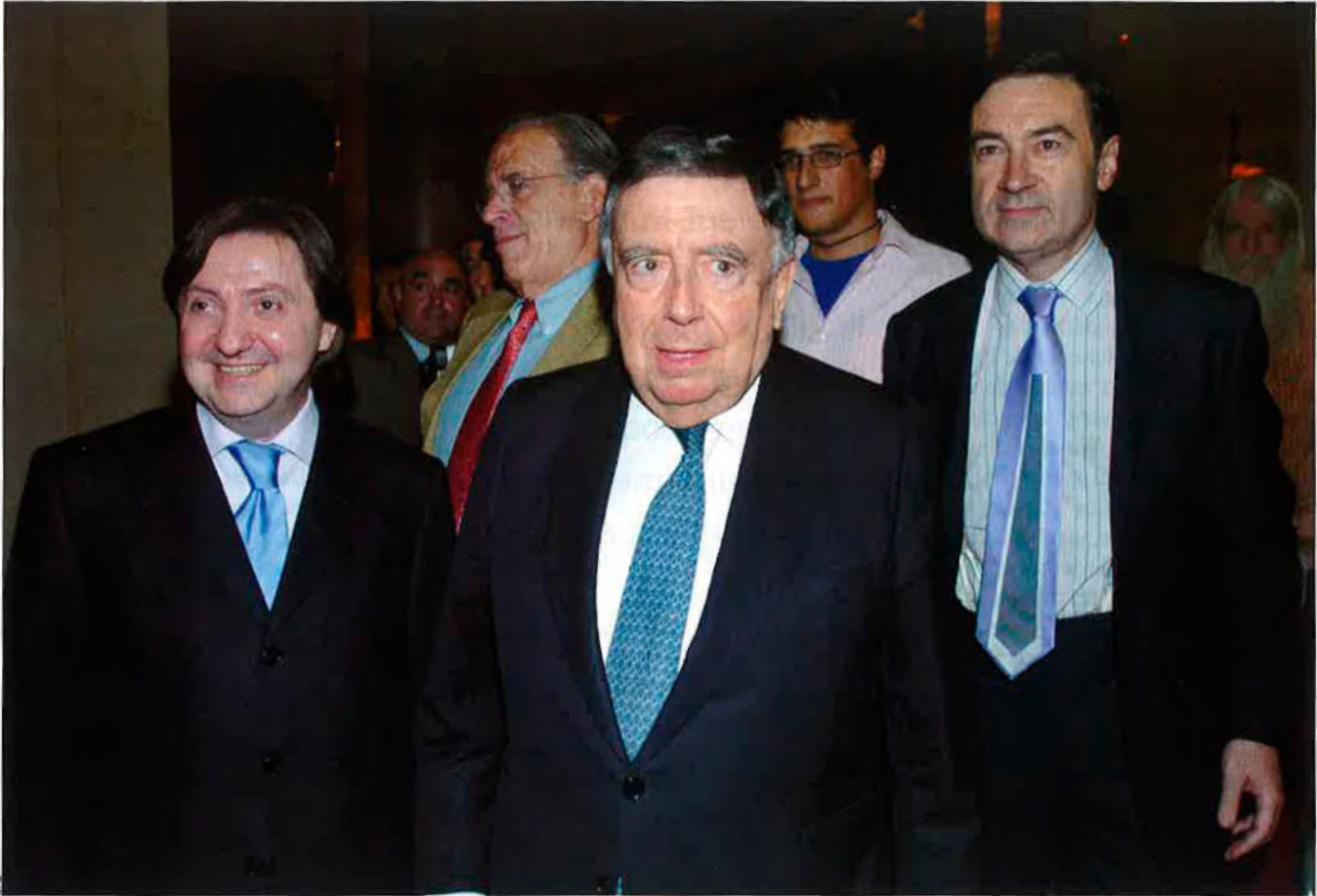
Federico J. Losantos, Luis M. Anson i Pedro J. Ramírez, l'any 2005, durant la presentació de Mis 100 mejores cartas del director. 25 años de la vida de España , escrit per aquest últim. Aquest trident és cabdal, a l'hora de copsar la penetració del discurs ultraconservador als mitjans de comunicació de tota mena.

La dreta radical espanyola s'ha tret la careta i inunda mitjans de tota mena.