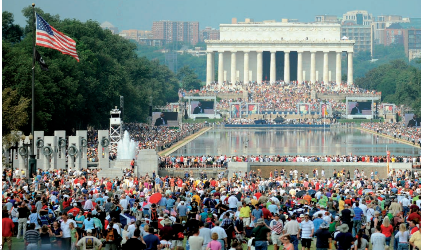
Concentració d'activistes del moviment ultraconservador Tea Party, a Washington, el mes d'agost proppassat. És el mateix punt on el 1963 Martin Luther

Els republicans esperaven utilitzar l'exaltació dels assistents a la Tea Party en benefici propi. Tanmateix, l'odi d'aquests activistes envers tots els polítics tradicionals també ha arrasat l'elit conservadora del partit. Els votants nord-americans volen candidats que siguin exactament com ells.