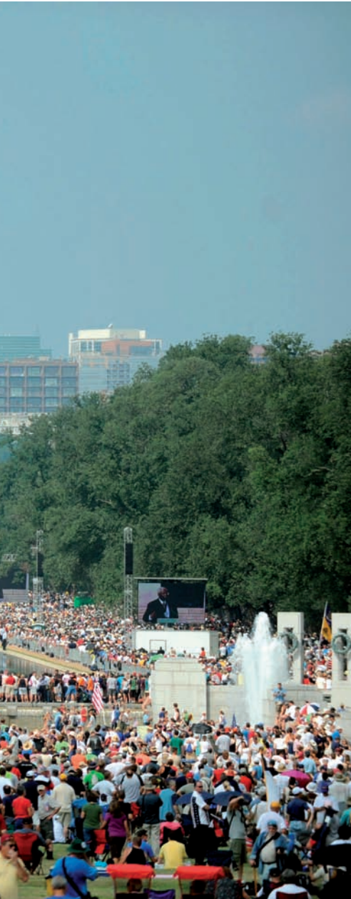
King pronuncia el discurs "Tinc un somni".

enjòlit des de fa més d'un any i el nom del qual hauria de recordar el principi de la revolució nord-americana.