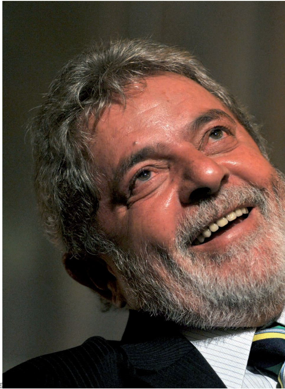
El president del Brasil, Luiz Inácio Lula da Silva, somriu amb la mirada perduda, moments abans

El primer de gener Lula da Silva assumeix el càrrec de president del Brasil.