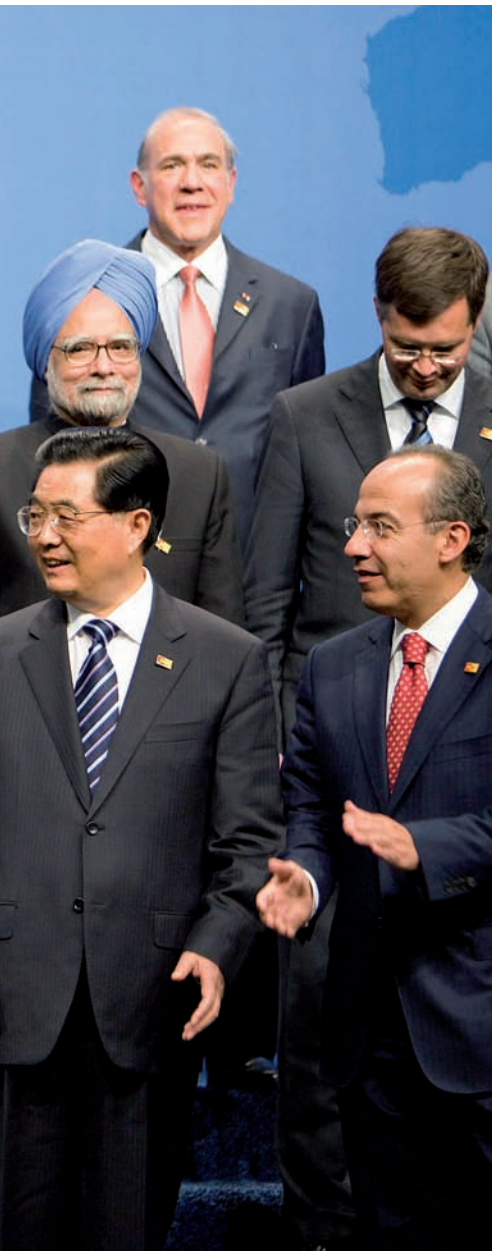
de l'any passat.

Prestigi internacional. Lula da Silva ha esdevingut allò que molts han anomenat la nova esquerra llatinoamericana , aquella esquerra que ha renunciat a la violència i que defensa el respecte de les llibertats individuals; accepta la importància que el capital privat té avui dia, sense deixar de banda el paper que ha de tenir l'estat en la lluita contra la discriminació social. Per aquesta raó Lula ha esdevingut un referent per a molts dels països de l'Amèrica Llatina, sobretot pel desig d'enfortir el paper de tota la regió en l'escenari mundial. Lula,