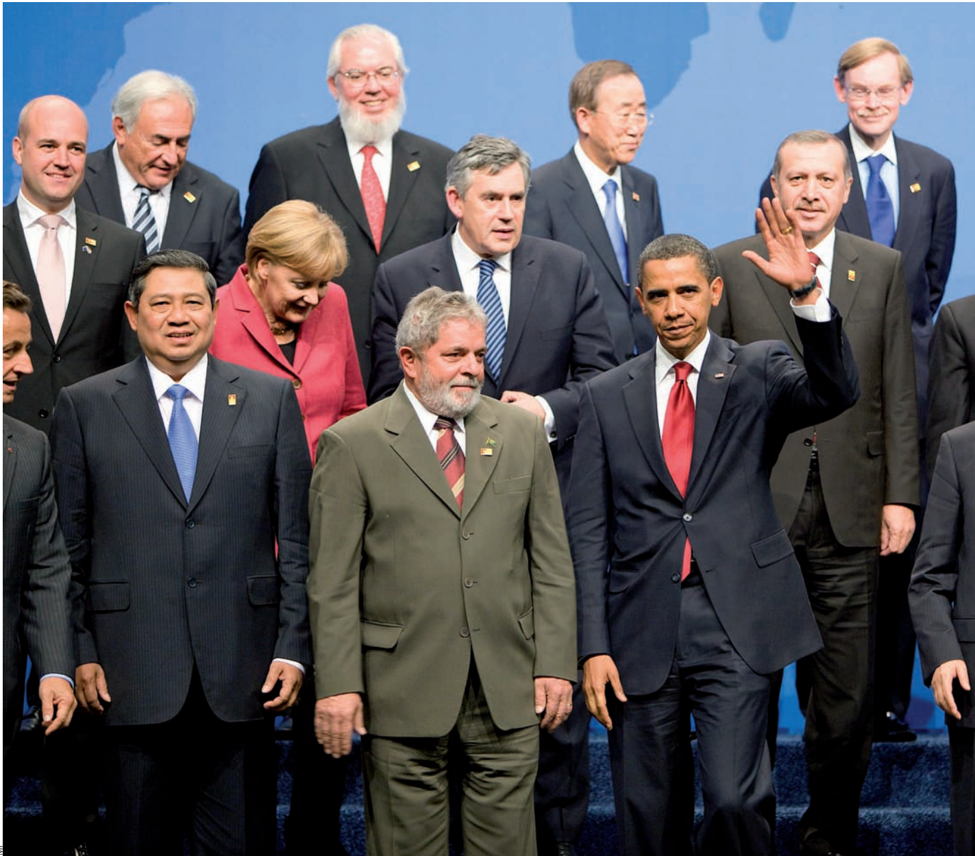
Lula da Silva posa al costat del president dels Estats Units, Barack Obama, durant la foto de grup de la cimera del G20, a Pittsburgh (EUA), el setembre