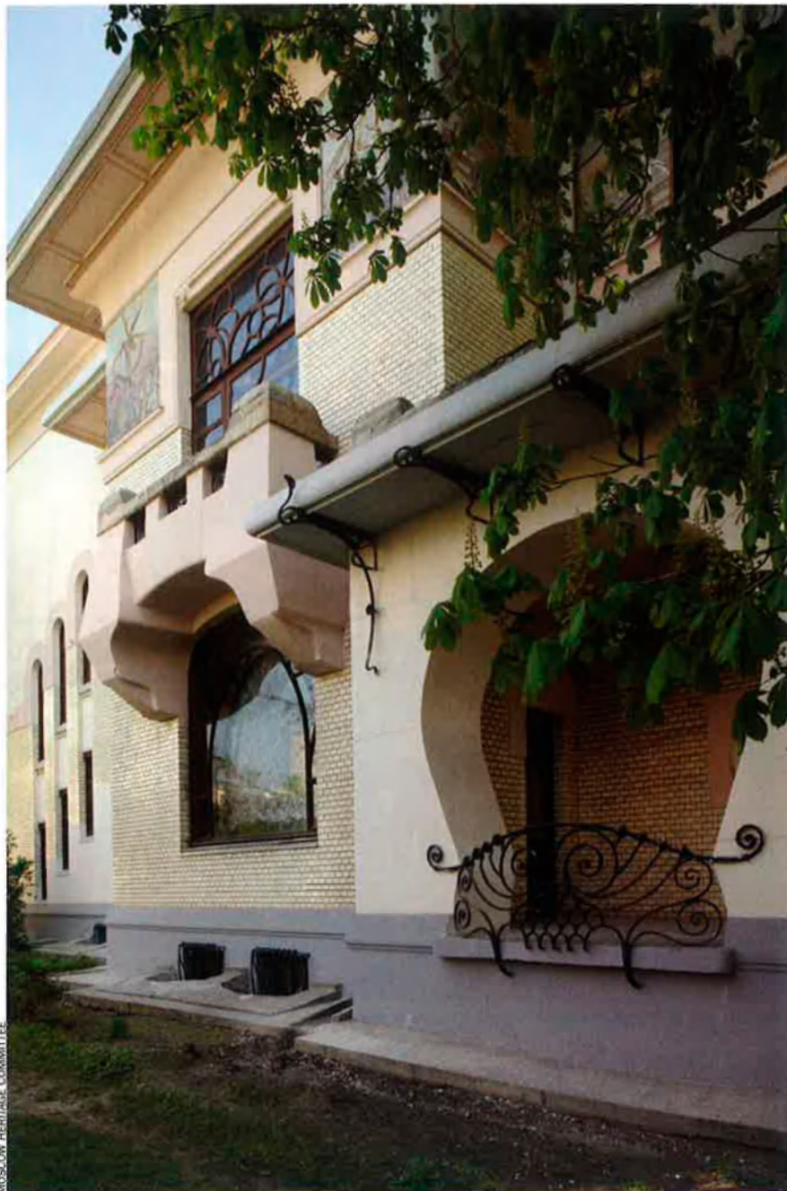
Façana lateral de la mansió Rabuixinski de Moscou, obra de F. O. Sekhtel, de l'any 1902.

Una mica més a l'est hi ha Budapest, la capital d'Hongria, que és una de les perles del modernisme que es desenvolupà en aquesta zona d'Europa en temps de l'imperi austro-hongarès. "A Hongria la idea de tractar l'arquitectura com una eina per a l'expressió de la identitat nacional prové del primer terç del segle XIX, però l'enfocament romàntic de l'arquitectura com a estimuladora de la independència cultural va arribar al màxim nivell artístic amb la revolució arquitectònica de la dècada del 1890",