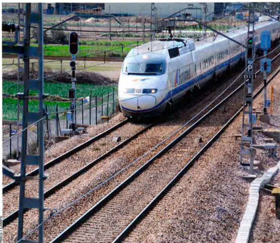
Un tren Euromed en passar per l'Horta.

De tot això, que avui sembla obvi, fa una dècada que en parla l'Institut Villalonga (IIVVEE), una institució que agrupa empresaris, professionals i institucions de Catalunya, Andorra, el País Valencià, les Illes Balears i la Catalunya Nord amb la intenció de fomentar la cooperació entre les regions de la Mediterrània nord-occidental, a partir d'unes coincidències històriques, lingüístiques, socials, i de mentalitat empresarial. L'abril passat, de fet, l'IIVVEE fou el responsable de congregar prop de 500 persones –entre empresaris, representants patronals i sindicals– al Palau de Congressos de