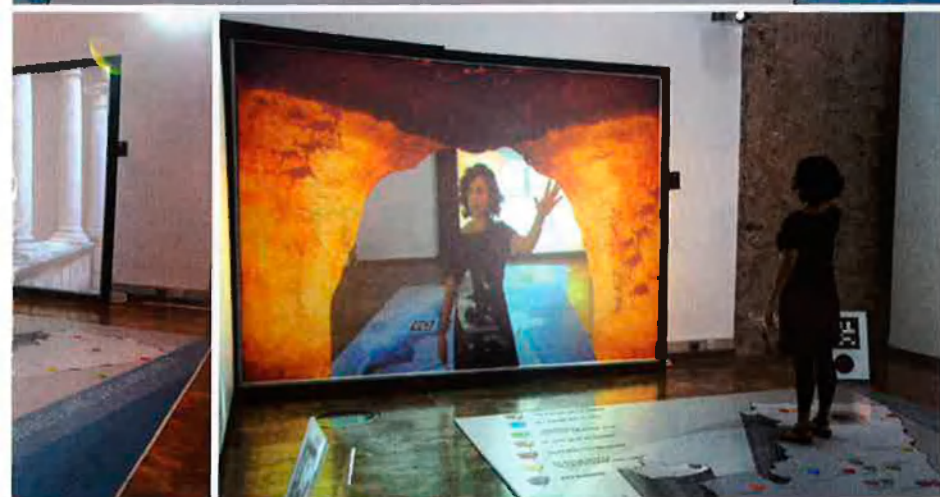
ra que la pantalla del costat projecta un vídeo sobre la vila. A sota, a l'esquerra, es trasllada a Oriola, i a la dreta, a les coves de la Valltorta, situades a Tírig (Alt Maestrat).

ra especial, perquè la mostra “ensenyava divertint, que diuen els anglosaxons”. Moreno explica que aquesta “targeta de visita” que és l'exposició no s'acabarà ací, sinó que serà itinerant.