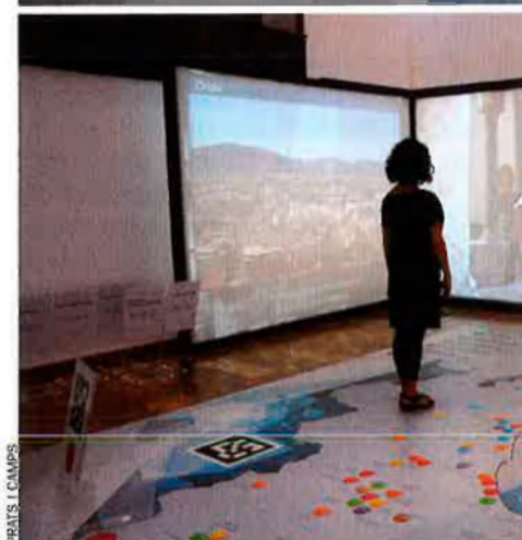
La visitant de dalt s'endinsa a les covetes dels moros de Bocairent (Vall d'Albalda), alho-