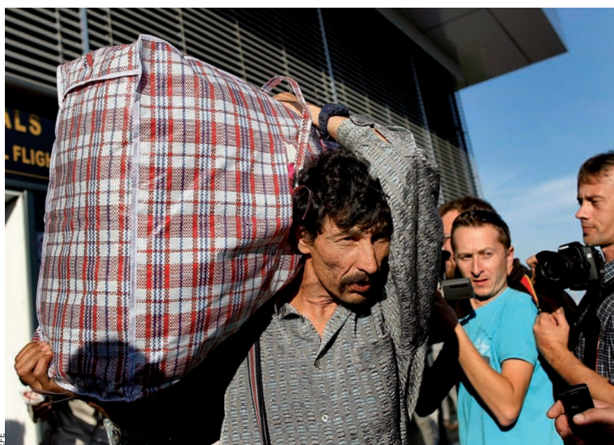
Segons Nicolas Sarkozy, els gitanos “són font de tràfic il·licit, condicions de vida profundament indignes, explotació de xiquets amb finalitats de mendicitat, prostitució o delinqüència”.

—És una iniciativa que va impulsar la nostra fundació amb un objectiu: