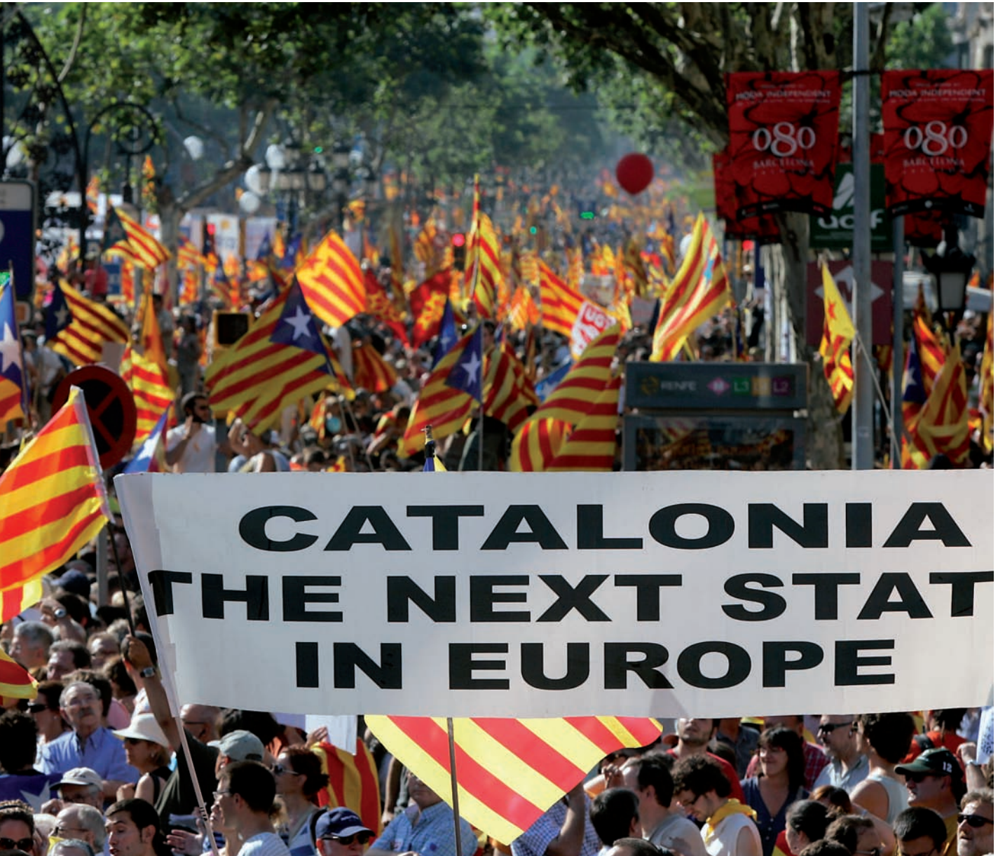
contra la sentència del Constitucional espanyol sobre l'Estatut. Aquesta sentència ha somogut les coordenades del mapa polític català.