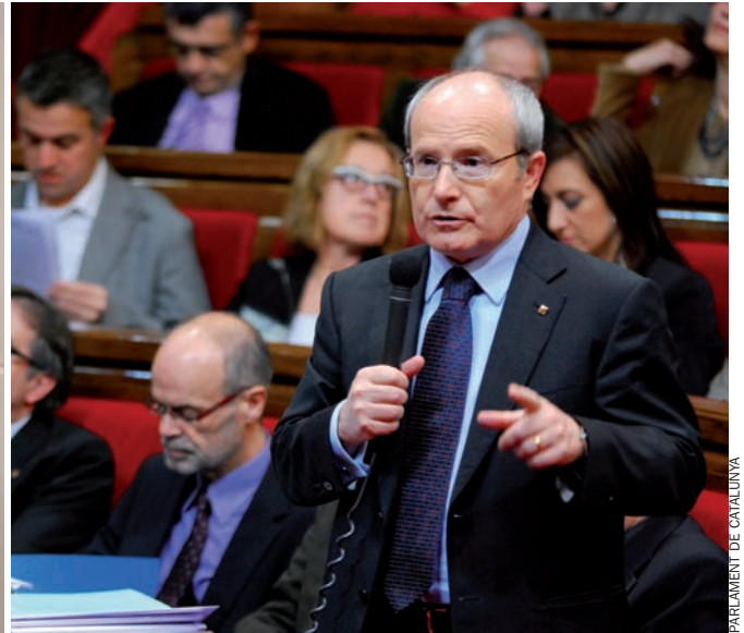
El candidat de CiU, Artur Mas, parteix com a favorit als comicis catalans. A la dreta, el president Montilla respon una interpel·lació al Parlament.

per majoria absoluta, sigui amb suports puntuals. De manera que Artur Mas podria ser escollit –després d’haver-ho impedit les aliances parlamentàries tant el 2003 com el 2006– president de la Generalitat.