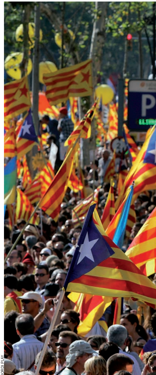
La manifestació del 10 de juliol a Barcelona.

govern a Catalunya, i el PSOE, partit de govern a l'estat espanyol. Aquestes contradiccions han reobert un vell debat dins el PSC sobre la necessitat de reforçar un projecte propi dels socialistes catalans i revisar les relacions amb el PSOE. I, novament, ha reaparegut el debat de la necessitat de recuperar el grup propi al Congrés de Diputats. Entre aquests sectors es destaca el conseller d'Economia, Antoni Castells, que ha preferit no repetir com a candidat del PSC. També el conseller d'Educació, Ernest Maragall, ha fet reflexions en un sentit similar, i la consellera de Justícia, Montserrat Tura. A l'altra banda del debat, figures com la ministra espanyola de Defensa, Carme Chacón, han anat agafant pes polític dins el PSOE i, fins i tot, alguns sectors la presenten com una possible substituta, en el futur, de Montilla. De moment, ja es considera segur que el ministre espanyol de Treball, Celestino Corbacho, deixarà el ministeri, probablement després de la vaga general del 29 de setembre –enmig d'un remodelatge de l'executiu que pot fer Rodríguez Zapatero a partir d'aquella data–, per incorporar-se a la llista electoral del PSC. Montilla, doncs, podria fer una llista que intentés incloure totes les sensibilitats que avui aplega el PSC, perquè les enquestes, ara com ara, evidencien que l'actual líder dels socialistes catalans tindrà moltes dificultats per a tornar a ser reelegit president, sigui pel desgast de la seva