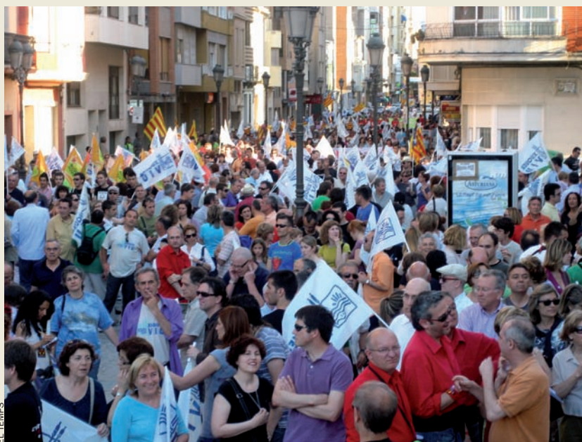
EL TEMPS El dia 29 de maig passat hi hagué una manifestació a Sueca en commemoració del cinquè aniversari de la multitudinària protesta del 2005, quan milers de persones de la Ribera s'oposaren al transvasament d'aigua del Xúquer des de Cortes de Pallars.

A poc a poc, però, Xúquer Viu anà guanyant-se la confiança de la gent de la Ribera, afegint socis de pobles d'ací i d'allà. Ho feren a base d'apel·lar a la sensibilitat de la gent, però, sobretot, posant sobre la taula arguments científics i tècnics que alertaven de la vulnerabilitat d'aquell corrent de vida. El 2005, quan es va convocar una gran manifestació per protestar pel transvasament Xúquer-Vinalopó projectat, Xúquer Viu havia aconseguit una victòria important: fer que la seua reivindicació traspasara l'àmbit merament