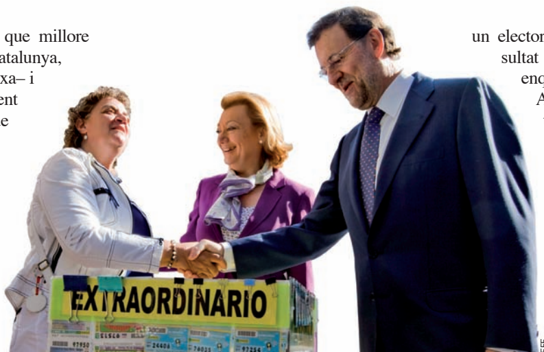
L’ex-presidenta del Congrés dels Diputats, l’aragonesa Luisa Fernanda Rudi, ja sap que serà candidata del PP a les autonòmiques del maig. A sota, a l’esquerra, José Antonio Monago, líder del PP extremeny, que sap que disputarà la presidència de la Junta d’Extremadura al socialista Guillermo Fernández Vara. Rajoy els fa costat.

Catalunya al cor. En efecte, la presència de Rajoy a Catalunya s’ha intensificat notablement. No sols ha visitat les quatre capitals de província, sinó que també s’ha arribat a Sant Cugat del Vallès, Sitges, Esplugues de Llobregat o a Deltebre. Ha participat en actes de partit menors alhora que assistia a celebracions populars molt concorregudes: a l’Aplec del Cargol de Lleida, a una botifarrada, a una sardinada o a la diada de Sant Jordi, per posar només alguns exemples. Alcía Sánchez-Camacho ha passat de