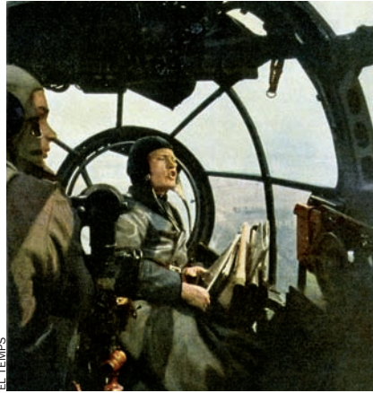
Vol d'aproximació d'un pilot alemany a Anglaterra (1940). També volien bombardejar els britànics en la mesa de negociacions.

Els britànics celebren el rescat, però en realitat el rescat oculta un desastre. Durant la Primera Guerra Mundial els britànics i els francesos van resistir quatre anys davant els alemanys. Ara, però, els invasors han arribat en poques setmanes a París.