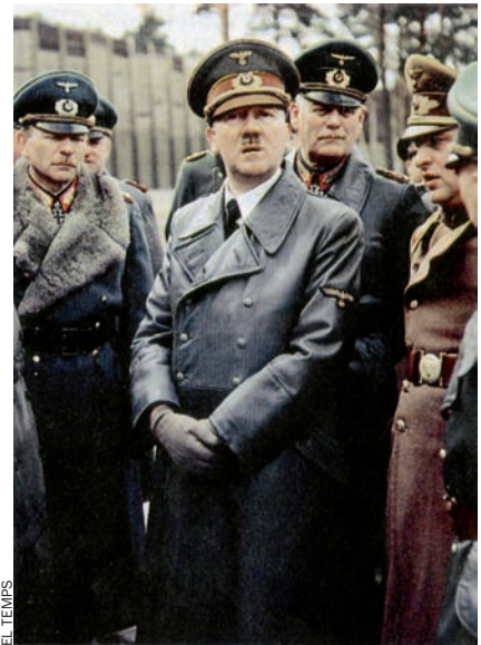
Hitler, un admirador de l'imperi britànic.

El mèrit de Churchill. Era l'estiu del 1940 i el nazi no havia estat mai tan a prop de guanyar la guerra com aleshores. Les tropes alemanyes havien deixat Polònia fora de combat, havien ocupat Noruega i havien derrotat i humiliat la gran potència francesa. Semblava només qüestió de temps que Hitler dominara tot Europa, perquè la Unió Soviètica s'havia unit a ell i els EUA esperaven a part, en la neutralitat. Però justament la Gran Bretanya, l'únic país que Hitler admirava i respectava realment, s'oposà al dictador. Churchill va explicar que per a ell només hi havia un objectiu: "La victòria, la victòria a qualsevol preu, una victòria malgrat tots els horrors, una victòria sense importar com de llarg i fatigós puga ser el camí."