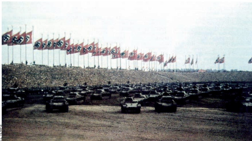
Desfilada de tancs al congrés del Partit Nacional Socialista dels Treballadors Alemanys a Nuremberg, el 1938. Els advertiments de Churchill sobre Hitler van ser ignorats.

La matança de la guerra de trinxeres refreda l'entusiasme romàntic de Churchill per la guerra; després de pocs mesos presenta la dimissió i torna a exercir un càrrec de ministre. Hitler, en canvi, ha de lluitar fins al final.