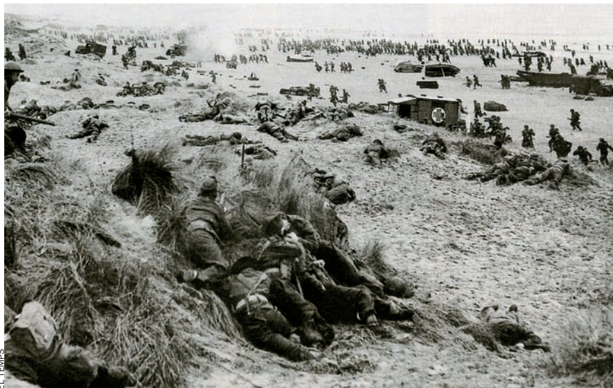
Soldats aliats a la platja de Dunkerque (1940). L'evacuació més important de la història dels britànics.

tics poden salvar-se d'un atac saltant amb el paracaigudes a terreny propi i, fins i tot, poden començar un nou atac el mateix dia; mentre que els pilots alemanys s'ofeguen al mar o, si aterren a terra ferma, van a parar a un camp de presoners de guerra.