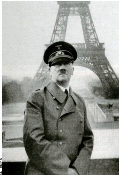
Hitler vencedor, a París el 1940.

La vesprada del 10 de maig, a 65 anys, seu en una limusina que el porta al palau de Buckingham, on el rei Jordi VI li dona l'ordre de formar un govern. A les seues memòries, Churchill escriu que va sentir "com si la meua vida fins aleshores haguera estat només una preparació per a aquell moment i aquella prova".