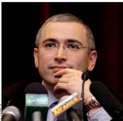
Mikhail Khodorkovski l'any 2001, durant una conferència de premsa quan era el responsable de la petrolera Yukos.

cap a les mercaderies és un risc quan els preus del mercat mundial són inestables. Les mercaderies continuen representant aproximadament un 70% de les exportacions russes. Rússia pot comptar amb més avantatges, com ara el sistema d'educació, relativament decent, i la força de treball, prou econòmica. Però aquest segon avantatge ja quasi ha desaparegut. Amb els preus tan alts del petroli, els salaris pugen a un ritme més accelerat que no la productivitat. De manera que només queda l'educació. Tot i que va de baixa, continua essent suficient per al desenvolupament d'una economia postindustrial innovadora. A Rússia només li cal fer un plantejament diferent respecte a les persones. Qui és capaç de generar noves idees, de crear empreses quan ni tan sols es garanteix la seguretat personal i quan en qualsevol moment es poden derivar els fruits del treball en benefici d'una burocràcia corrupta? El meu exemple indica als possibles finançadors d'empreses innovadores que Rússia no és el lloc indicat per a invertir. En resum: no tenim alternativa. Sense reformes polítiques és impossible l'empenta modernitzadora. Putin ha de demostrar que situa els interessos del país per sobre de la burocràcia i de les seves pròpies ambicions.