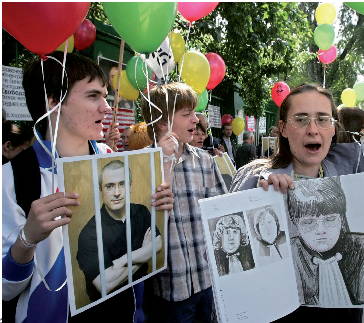
Simpatitzants de Mikhail Khodorkovski es manifesten davant el tribunal de Meixanski, a Moscou, el 2005, per reclamar el seu alliberament.

governamentals fessin ostentació dels milions adquirits per mitjà de la corrupció, de la manera com es fa avui. És impossible d'imaginar que els organismes governamentals creats per mantenir la llei es facin servir clarament per explotar empreses del sector privat. Hi ha normes bones i normes dolentes. És negatiu que ja no hi hagi normes o que les lleis es deixin de banda per algun objectiu polític. Avui dia, els conflictes empresarials se solen resoldre per mitjà de la força. S'agafen ostatges per exercir pressió sobre els propietaris de les empreses. Es limiten a tancar a la presó un soci nou, un amic o un subordinat.