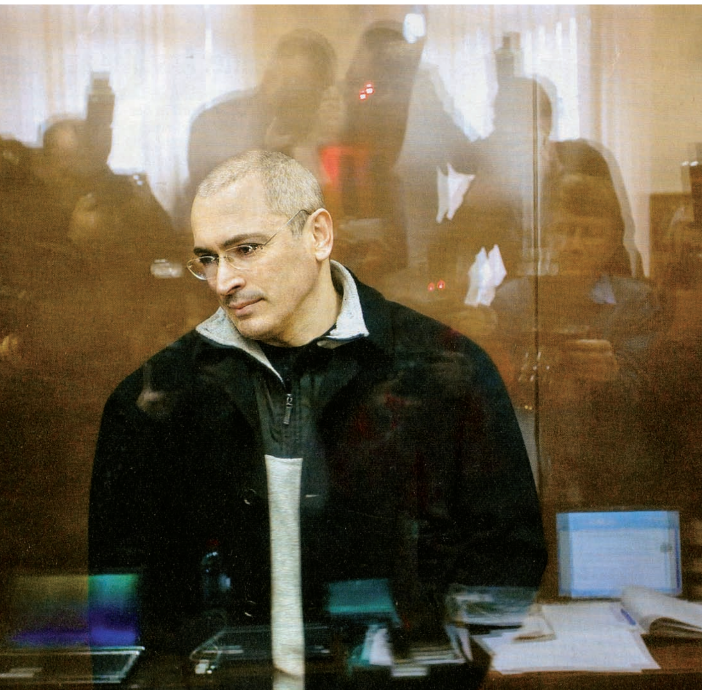
segon procés que en l'actualitat hi ha obert contra ell.

ció del judici i en les vistes. Fa un any i mig que sóc a Moscou, a la presó anomenada El silenci del mariner . Els meus dies són condicionats pel procés i el règim carcerari. Els dies feiners vaig a la sala del tribunal, fora d'un dia la setmana, que el dedico a treballar amb els meus advocats.