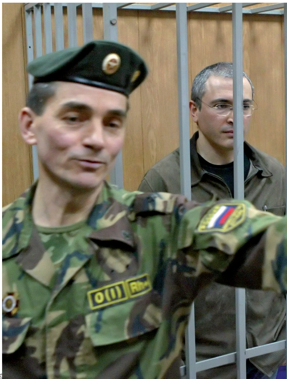
Khodorkovski i Platon Lebedev, ex-president del grup Menatep, durant una sessió del judici que

—Sempre he defensat les meves conviccions i allò que he considerat que era la veritat. Quan vaig veure clar que a l'era dels soviets ens enganyaven, vaig anar a les barricades. D'aleshores ençà, la meua principal preocupació ha estat de reivindicar la llibertat d'expressió. La dissolució de la darrera xarxa de televisió independent, l'NTV, el 2000, en concret, em va obligar a adoptar una opinió més crítica envers el Kremlin. Pel que fa al meu èxit com a empresari, ens hem de remuntar a l'any 1987. En aquella època, unes quantes persones com jo vam decidir d'apostar per un futur garantit per l'estat en canvi d'una carrera incerta com a empresaris. I el 1996, un nombre també reduït de persones va decidir d'esmerçar tots aquells diners que havia guanyat amb tanta suor en una empresa que era a punt d'extingir-se [el cas de Yukos en aquella època], i ho va fer sis mesos abans d'unes eleccions que tothom esperava que guanyessin els comunistes. Vaig apostar-hi... i vaig guanyar.