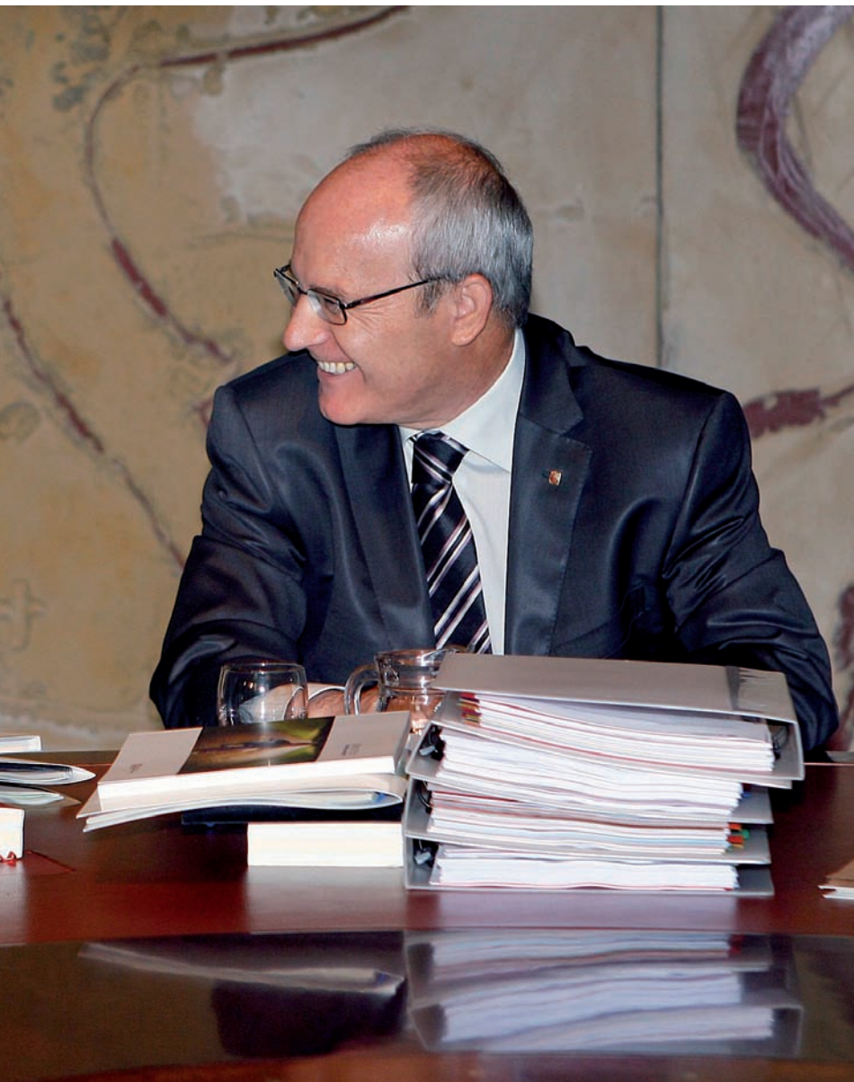
ciés la seva renúncia a anar a les llistes del PSC.

que es llegeixi l'entrevista amb Castells "a poc a poc" i prometia tornar-hi en un futur: "En seguirem parlant."