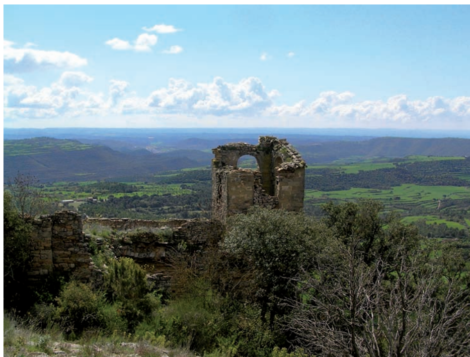
Borrell, quan els catalans van saquejar aquesta ciutat, el 1010. Imatge actual de les restes de l'església del castell de Montmagastre, prop d'Artesa de Segre, a la comarca de la Noguera, d'on hom creu que va partir l'expedició a Còrdova l'any 1010.