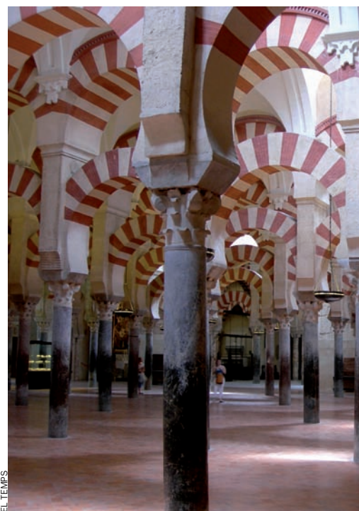
Imatge actual de l'interior de la mesquita de Còrdova, que ja existia en temps de Ramon