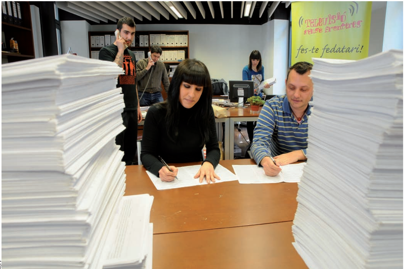
La recollida de signatures s'ha centralitzat a la seu d'Acció Cultural a València.

que la Junta Electoral Central, que ha de validar les signatures, en rebutjara o n'invalidara alguna. Al remat, però, el nombre de signatures arreplegades supera, amb escreix, les millors expectatives. Són 651.650 signatures, és a dir, 651.650 persones que s'han