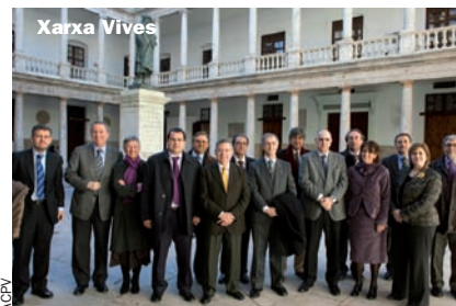
Safor) i el Bartolo (Benicàssim, Plana Baixa).

Concentracions contra el tancament de TV3 al País Valencià als repetidors del Montdúver (Gandia,