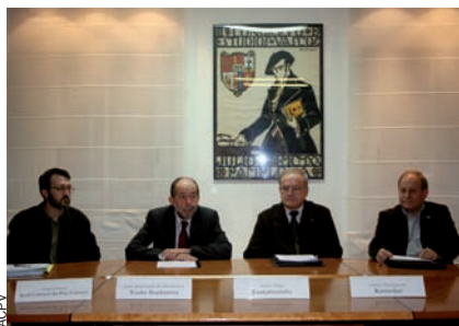
“Televisió sense fronteres” arran de l'amenaça de desaparició d'Euskal Telebista a Navarra.

Ha estat gràcies a aquesta capacitat d'amalgamar sensibilitats diverses que els promotors han obtingut uns resultats rotunds, rotundíssims. L'objectiu d'Acció Cultural era enviar a Madrid 550.000 signatures, un 10% més de les requerides per llei, de manera que aquestes 50.000 de més serviren com a assegurança en cas