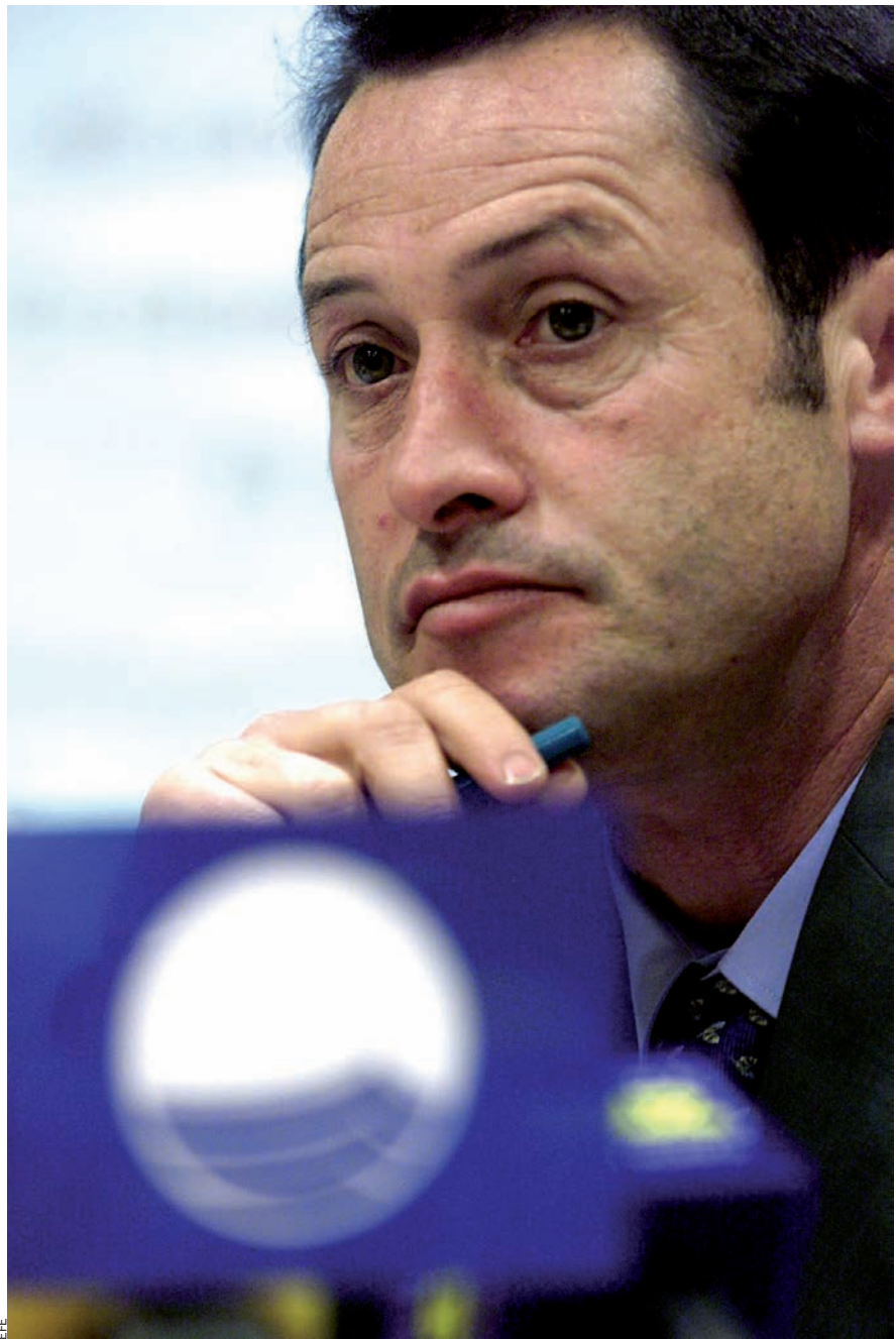
La plantada de setze diputats zaplanistes del 2004 fou una manera "d'expressar el descontentament d'una part del partit, un descontentament que fins i tot diria que avui s'ha agreujat".

—Sí. Vam coincidir en diverses societats públiques de València, des que ell