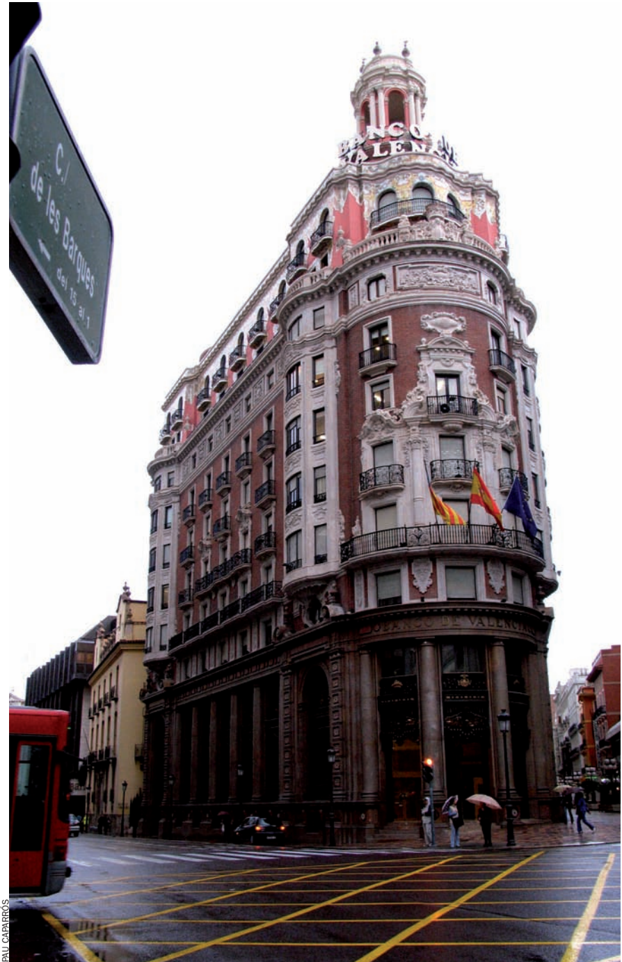
La seu del Banc de València és a la confluència dels carrers de les Barques i Pintor Sorolla.