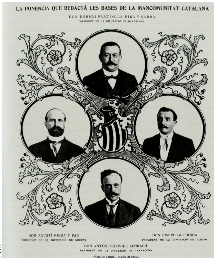
Portada de la Il·lustració Catalana del 22 d’octubre del 1911, amb els quatre presidents provincials.

El segon parla de la necessitat que van tenir les elits locals de fer servir les institucions existents per gestionar, tant com fos possible, la conflictivitat local i defensar davant l’estat els interessos propis.