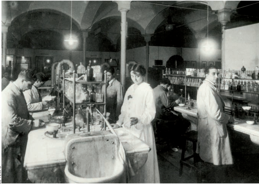
EL TEMPS Laboratori d'Estudis Superiors de Química de l'Escola del Treball.

litat, significativa i d'un alt contingut simbòlic.