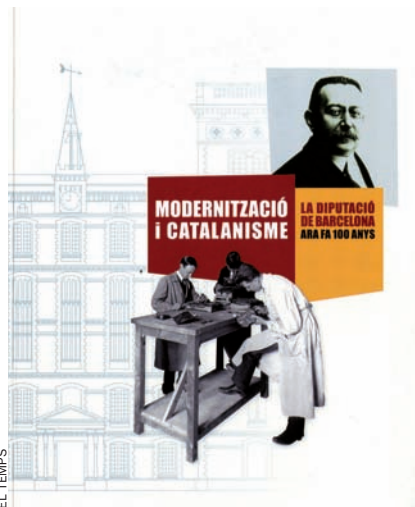
EL TEMPS Cartell de l'exposició, oberta a Can Serra.

El IEC va permetre d'estendre l'obra de la Diputació més enllà del seu àmbit geogràfic. La llengua, objecte d'estudi i normalització del nou organisme, era la de tots els catalanoparlants, no solament la dels barcelonins. Prat de la Riba va encarregar personalment a