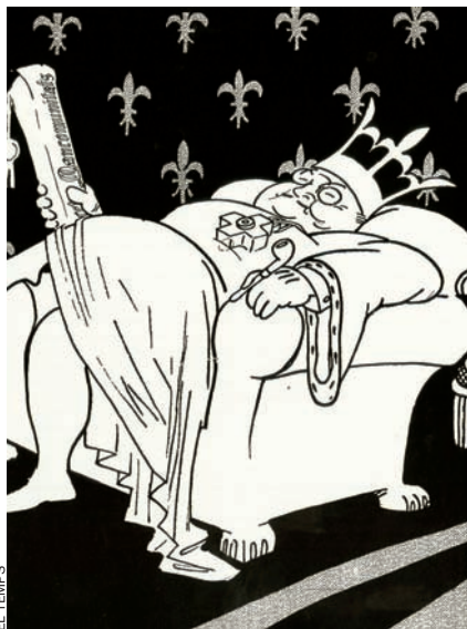
Caricatura d'Enric Prat de la Riba, realitzada per Picarol. L'Esquella de la Torratxa del 24 de desembre del 1913.

ment les prioritàries, i arreu d'Espanya era habitual que l'apartat de beneficència s'emportés entre el 30% i el 40% de les despeses.