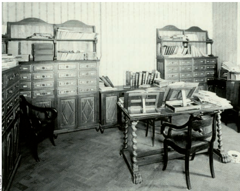
Sala del Palau de la Generalitat on es va reunir per primera vegada l'Institut d'Estudis Catalans. Porta d'entrada a la biblioteca del IEC. 1914.

A més de les vies de comunicació, les altres iniciatives importants de la Diputació presidida per Prat de la Riba foren la recuperació del projecte de canalització del Llobregat, a banda de la reconstrucció del Palau de la Genera-