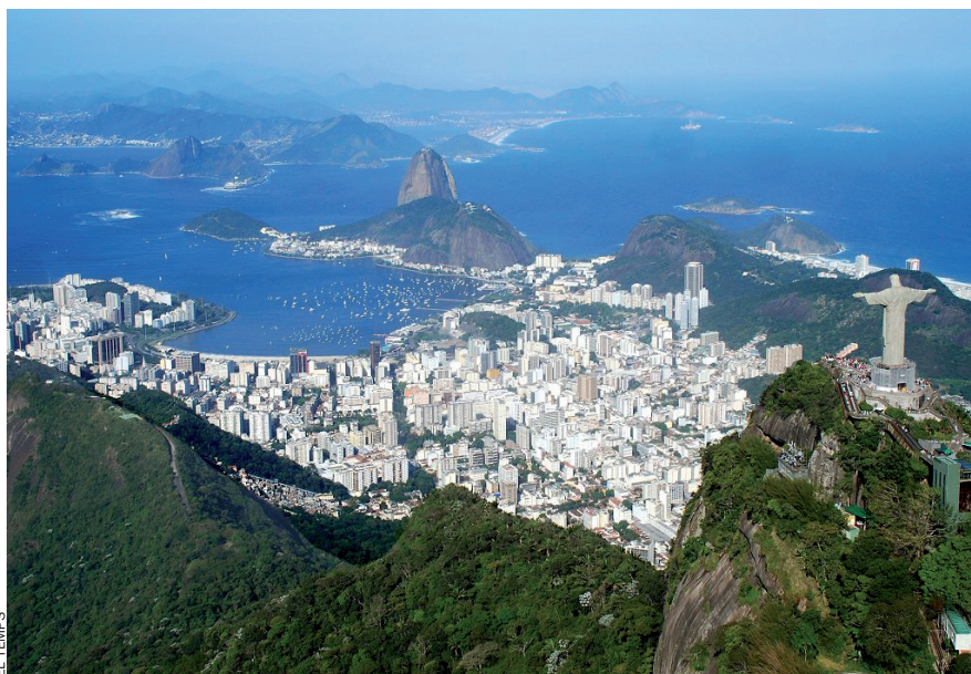
“Brasil: present i futur d'un gegant” és un dels cursos de la Universitat d'Estiu de Gandia - Universitat de València.

Les universitats de la Xarxa Vives i la Universitat Catalana d'Estiu ofereixen més de 850 cursos que es duen a terme a 94 localitats però també a distància. Més informació, a www.estiu.info .