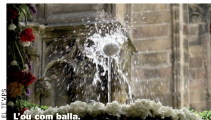
L'ou com balla.

natura. Menjar ritual dels Pelegrins de les Useres , a la fi d'abril i, plens de gràcies, màgics talismans de la nit de Sant Joan. Des de la vespra (enguany el 5 de juny), i al llarg de la diada de Corpus, al brollador del temple gòtic de Sant Jordi de la catedral de Barcelona, envoltat de sagrades oques blanques, enllaços entre el cel i la terra, l' ou com balla . A la pica del sortidor, “quan l'ou, que neda damunt de l'aigua de la pica va a parar damunt del raig, aquest l'enlaira i el fa jugar i giravoltar” (Amades). Hom vol que l'ou, en moviment continu, siga un símbol de l'hòstia consagrada eucarística, però tot fa pensar en un ritu a la fecunditat o una forma d'adoració solar. L'ou és contenidor de vida, una cèl·lula que guarda i engendra vida; al Gènesi un ou còsmic, covat “sobre la faç de les aigües”, va generar el món. L'aigua, prenyada de virtut, amorosa, fèr-