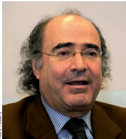
FRATS I CAMPS

—No ha estat tractat amb la consideració que es mereix el president del Barça i, en alguns casos, no li han reconegut ni tan sols la importància de les lluites que ha encapçalat com, per exemple, la seva voluntat de posar fi als violents. A més, algunes idees