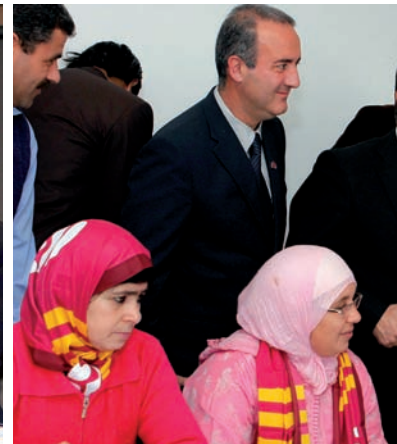
La Ciutat Esportiva és una realitat. Demà potser ho serà el projecte de Foster. Els ingressos augmenten, el planter funciona i el club és solidari.

vuit dies que va ser president el juny del 2003, abans no començara la temporada següent. Per això s'ha estat set anys i no vuit –a partir d'ara, a més, els mandats passen a ser de sis anys i no de quatre–; en el cas dels avals , la justícia va determinar que la junta havia d'haver avalat –amb 1,6 milions per cap– el deute net del club, abans d'accedir-hi. La decisió ha estat objecte de recurs al Tribunal Suprem.