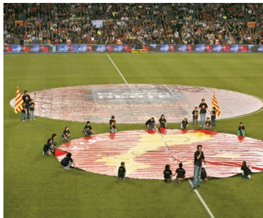
Laporta hi ha imprès un to marcadament catalanista: juntes itinerants, homenatges a Jaume I, visites a la tomba de Fuster i Correllengua a l'Estadi.

molt, i les han organitzades de manera diferent: a l'àmbit I no sols hi ha ara les catalanes, sinó també les valencianes i balears. D'una altra banda, s'han eradicat els grups violents del Camp Nou.