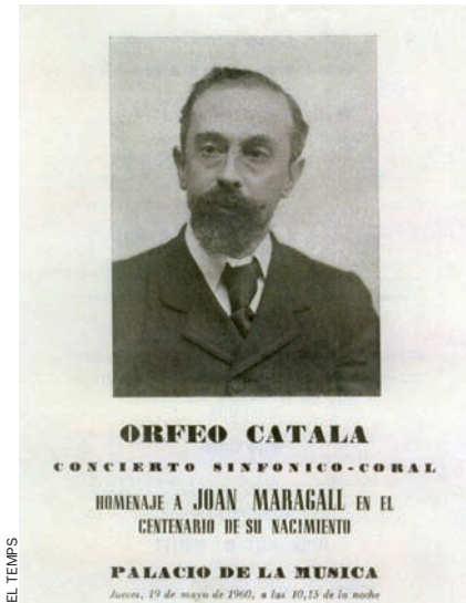
Portada del programa de l'homenatge a Joan Maragall celebrat al Palau el 1960.

De fet, en aquells anys, el "Cant de la Senyera" només podia ser interpretat per algunes corals, sempre que no formés part d'un lloc destacat del repertori. L'Orfeó, tanmateix, no havia volgut mai acceptar aquesta condició i preferia no cantar-lo. Però, en acostar-se la data del centenari, els responsables de l'entitat van creure que era un bon moment per a incloure aquesta peça, d'una gran càrrega simbòlica per a l'Orfeó, al començament de la tercera part del concert d'homenatge a Maragall. L'administració del Palau va tramitar la preceptiva sol·licitud del permís, i presentà, com era obligació,