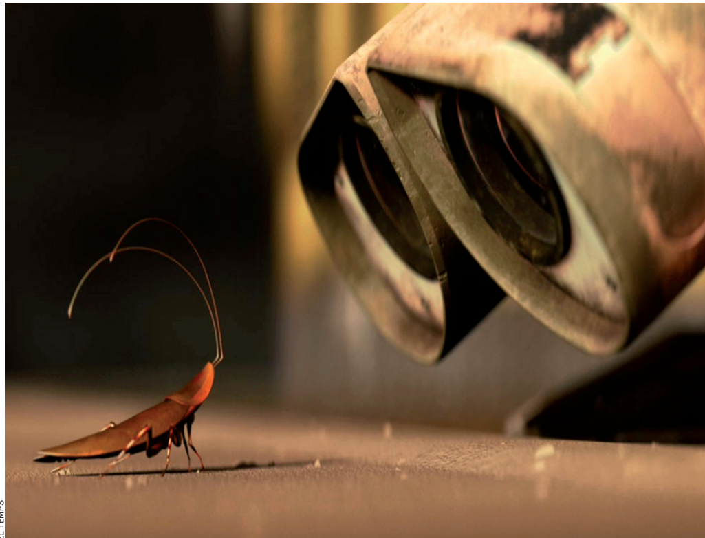
Qui pot ser l'única amiga del robot Wall-e en una Terra desolada per les deixalles i la contaminació? Una panerola, és clar. De dibuixos animats, però tendrà i divertida.

Art i literatura també han contribuït, en els diversos vessants, a ratificar-ne la mala imatge. Des de la famosa metamorfosi narrada per Franz Kafka ("Un matí –comença– quan Gregor Samsa despertà d'un somni intranquil, es trobà al llit convertit en un insecte monstruós") fins a tants films de sèrie B com ens puguem imaginar (on solen fer acte massiu de presència i acompanyades d'un inquietant xerric que el setè art ja identifica amb el concepte: "munió d'insectes no voladors però molt repulsius"), han quedat indefectiblement associades a l'horror. Fa de mal imaginar que la