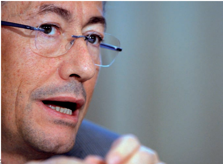
Segons Luna, que fou alcalde d'Alacant del 1991 al 1995, "Camps té una concepció de la democràcia purament instrumental: sóc escollit per a quatre anys i puc fer i desfer com jo vulga".

—És inconcebible que defensen Camps d'aquesta manera, si no hi ha res que afecte les finances del PP. Gènova no té mans lliures per actuar contra Camps perquè també està esguitada pel finançament irregular.