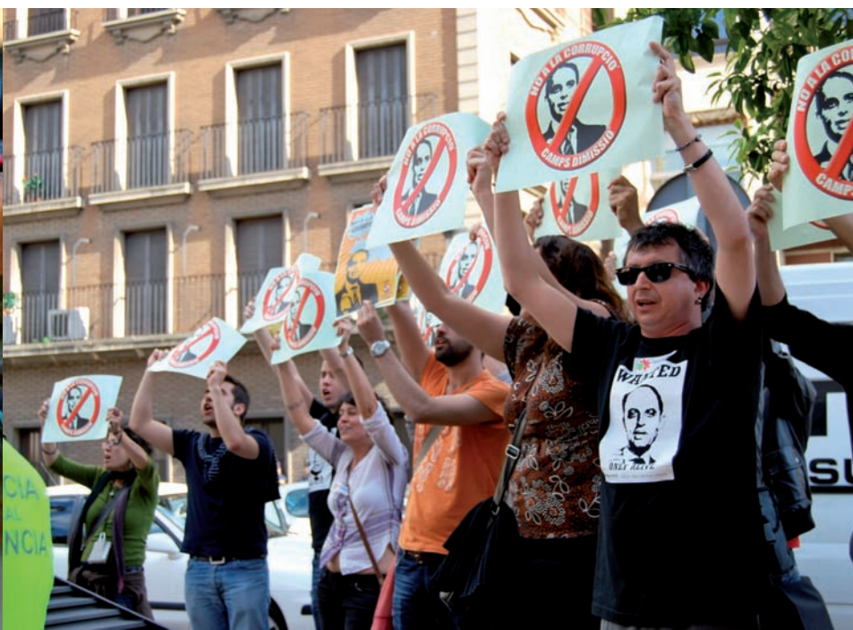
la junta directiva del PP. A la porta de la seu, tres desenes de persones van exigir-li la dimissió.