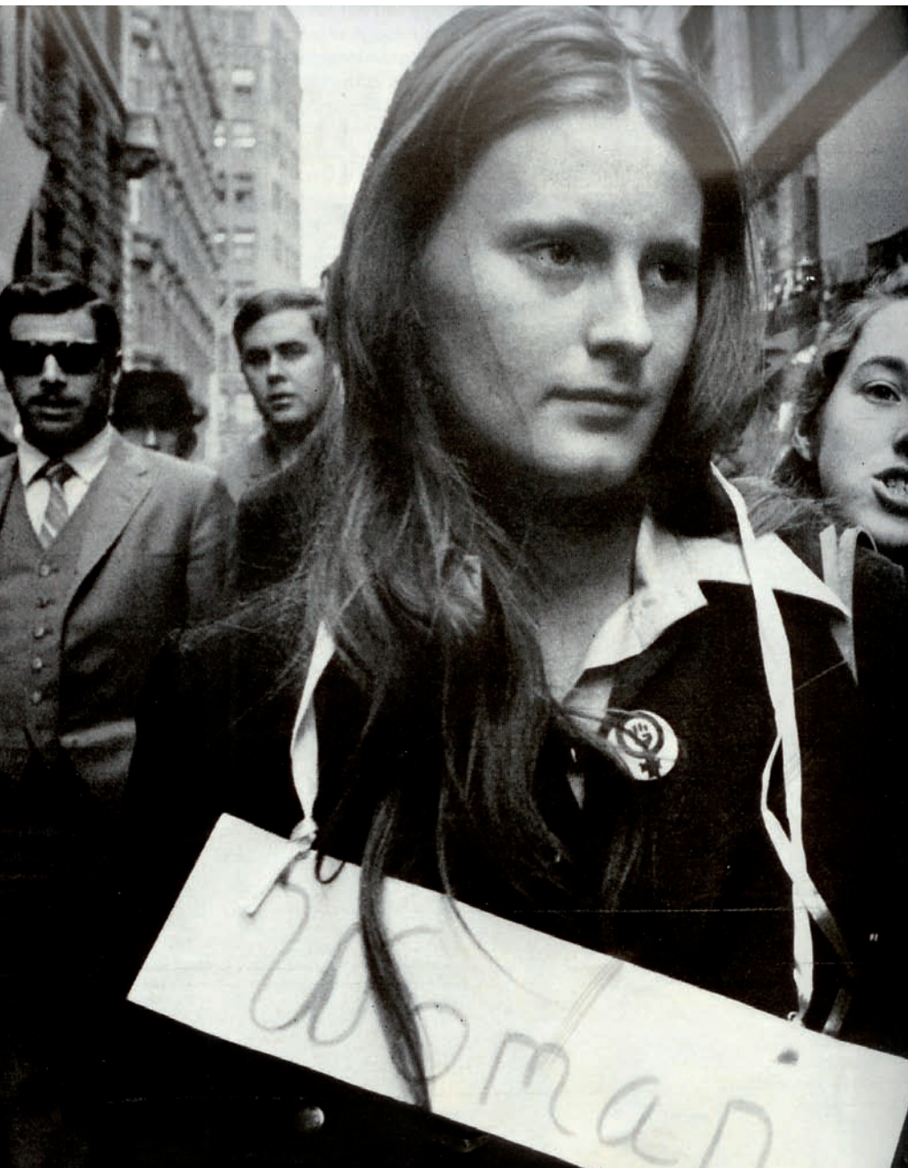
Els moviments d'emancipació de les dones es feren forts durant tot el segle XX.

Tot cercant la fórmula màgica. Esmentar un sol responsable que avui més de cent milions de dones comencen la jornada engolint una pastilla no és pas senzill. Foren diversos, i amb finalitats contraposades, que van coadjuvar a elaborar un medicament per a impedir que cada relació sexual acabara a la sala de parts. De fet, l'assoliment i la comercialització de la píndola foren deguts a un conjunt de casualitats i troballes accidentals. Al començament d'aquest laberint, posem-hi Margaret Sanger, natural de Corning, a Nova York. Sanger havia quedat òrfena de jove. Sa mare havia mort a cinquanta anys, després d'haver portat a aquest món divuit criatures. D'aquella circumstància, en nasqué un esperit rebel determinat a trobar la manera de posar fi a l'esclavatge a què s'havia vist sotmesa