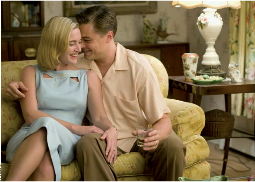
Al film Revolutionary Road , un naixement inesperat fa trontollar la parella, interpretada per Leonardo di Caprio i Kate Winslet.

és ginecòloga i obstetra, va viure en primer persona el procés des del grup Dones per l'Autoconeixement i Anti-concepció (DAIA), del qual va formar part del 1974 al 1984. Aquesta pionera i les seues col·legues feren mans i mànigues per "transmetre a les dones els coneixements que en matèria de contracepció hi havia a la resta del món". Cal tenir en compte que a casa nostra els contraceptius eren il·legals fins a la mort de Franco, de manera que la píndola era a les farmàcies però només es dispensava com a regulador menstrual. "Vam fer bona cosa d'il·legalitats!", recorda Almirall. Des del grup de DAIA, doncs, es dedicaren a fer pedagogia per descobrir a la gent de peu pla els beneficis dels mètodes contraceptius. "Anàvem pels barris... per donar informació." La píndola, segons relata, "despertava molta por, molts dubtes. D'una banda, hi havia ganes d'aprendre coses noves; d'una altra, hi havia molta por per culpa de mites, com ara que era cancerígena".