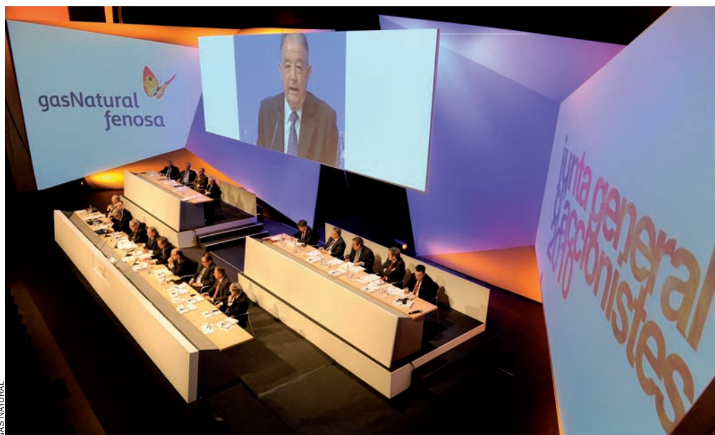
Gas Natural Fenosa, a la junta del dia 20 d'abril passat, explica als seus accionistes les claus dels excel·lents resultats econòmics del 2009 i els presenta la nova imatge de marca del grup.

Renovables, no a qualsevol preu. El nou grup sorgit de la fusió de Gas Natural i Unión Fenosa no es gira d'esquena a les energies renovables. Hi creu i inverteix en la recerca. Però no està disposat a abocar-hi grans quantitats de diners fins que no se n'aclareixi la rendibilitat econòmica. L'anàlisi que fa la companyia de la situació d'aquestes energies és crítica en dos sentits. I aquí venia el segon missatge políticament incorrecte de la jornada. L'estat espanyol sobre-subvenciona un sector que encara no s'ha demostrat que sigui rendible socialment i en termes de negoci. Gas