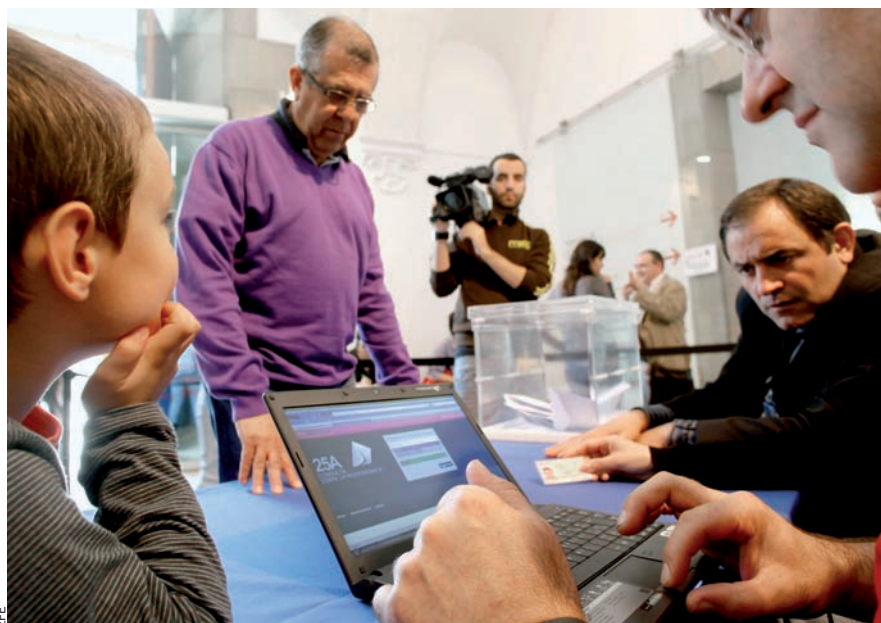
A la jornada de votacions del 25 d'abril, una vegada més, es va posar a prova un sistema informàtic rigorós que va servir per a evitar duplicitats de vots.

La tercera onada de consultes per la independència tanca amb una mica més d'un 17,5% de participació i fa pujar a gairebé mig milió la xifra de persones que han participat en aquests referèndums.