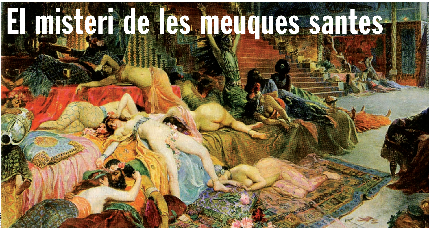
EL TEMPS Lloc de pecat a Babilònia (quadre de Georges-Antoine Rochegrosse, 1891).

“Prostitutes sagrades” i sexe al temple en honor d’Afrodita. Molts autors de l’antiguitat descriuen de manera clara la prostitució sacra. Són només llegendes? Els historiadors investiguen quina part de veritat contenen els documents. Hi ha sospites que, temps enrere, els temples dedicats als déus feien alhora la funció de bordells.