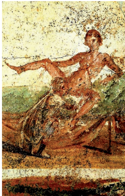
A l'esquerra, escultura d'Afrodita. Al mig, escena eròtica entre un jove i una hetera, que forma part del vas del pintor de Xuvalov (Altes Museum, Berlín). A la dreta, pintura mural de Pompeia.

canviar el nom per Afrodita. Segons el mite, la bellesa va eixir d'un indret sangonent a la mar, tenyit de roig i ple d'esperma. En aquell indret és on el tità Cronos havia llançat els genitals del seu pare, que li havia tallat prèviament.