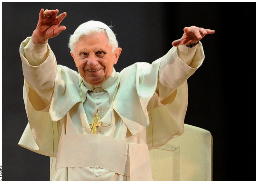
Joseph Ratzinger, el 2002, va negar-se a admetre la crisi que havien generat totes les denúncies.

Només a Palerm, un grup dirigit per un sacerdot es va ocupar aquest darrer any de 824 víctimes d'abusos. Segons una investigació duta a terme pel diari La Repubblica , s'han condemnat més de quaranta sacerdots per casos d'abu-