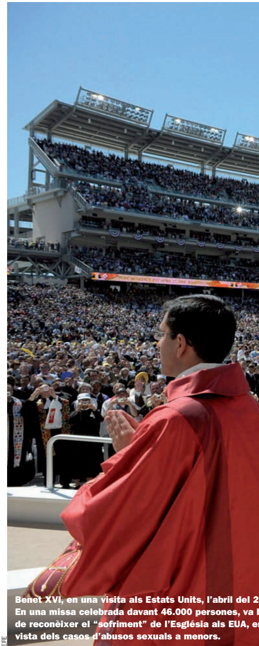
Benet XVI, en una visita als Estats Units, l'abril del 2008. En una missa celebrada davant 46.000 persones, va intentar reconèixer el "sofriment" de l'Església als EUA, en vista dels casos d'abusos sexuals a menors.