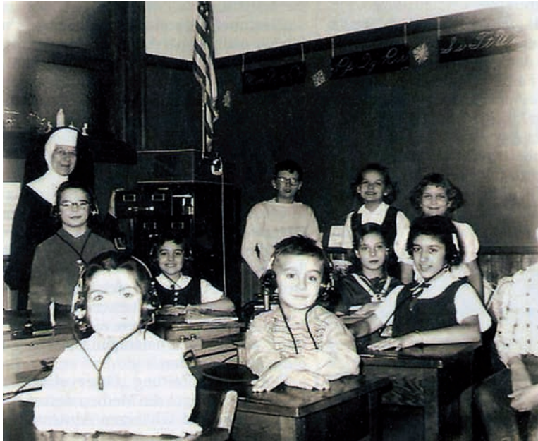
Nens sords de l'Escola St. John. A la dreta, Ratzinger, el 1998, en una imatge de quan era cardenal.