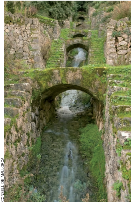
L'aigua i la pedra en sec conformen el paisatge de la serra de Tramuntana

cada de manera molt determinant pels marges de pedra en sec i el conreu de l'olivera– ha estat el resultat de l'evolució històrica de la comarca. La presència de marges a zones de pendent extrem, o bé a zones de roca nua, ens parlen de les èpoques en què va ser necessari estendre al màxim les zones de cultiu a conseqüència de la pressió d'una població creixent en una illa de recursos limitats. Per contra, el desplegament de sistemes de regadiu de gran complexitat tècnica, els orígens dels quals es remunten a l'època musulmana, ofereixen la imatge de fertilitat i prosperitat que contrasta fort ferm amb l'austeritat marcada per les oliveres de les zones més extremes. D'aquesta manera, és possible de reconèixer en el paisatge les marques deixades per cadascuna de les èpoques històriques que se superposen a la serra.