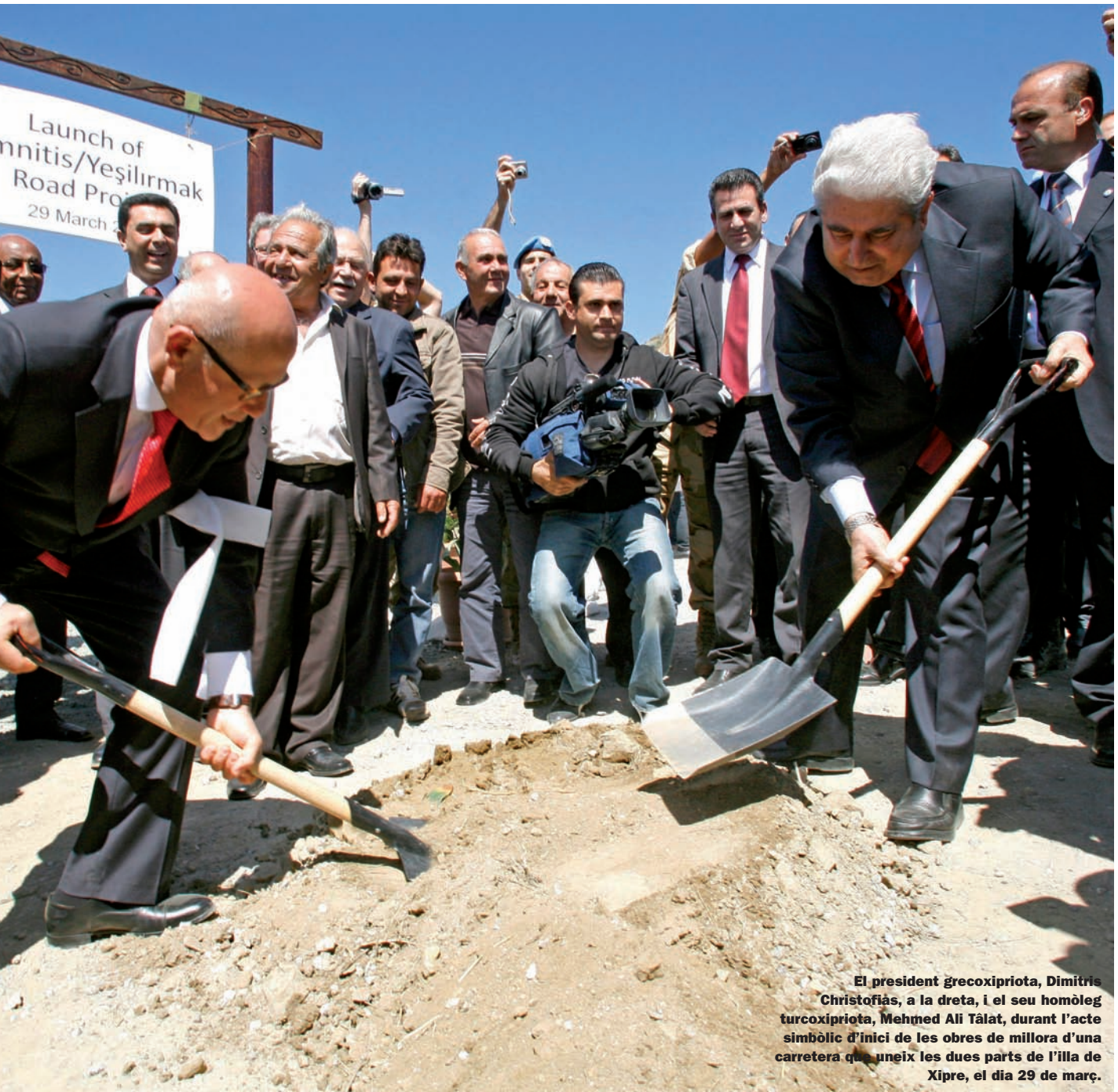
El president grecoxipriota, Dimitris Christofias, a la dreta, i el seu homòleg turcoxipriota, Mehmed Ali Talat, durant l'acte simbòlic d'inici de les obres de millora d'una carretera que uneix les dues parts de l'illa de Xipre, el dia 29 de març.

i encara hi manté una important base militar. Pel que fa a Alemanya, la cancellera Angela Merkel ha posat com a condició que Turquia compleixi tots els requisits d'ingrés.