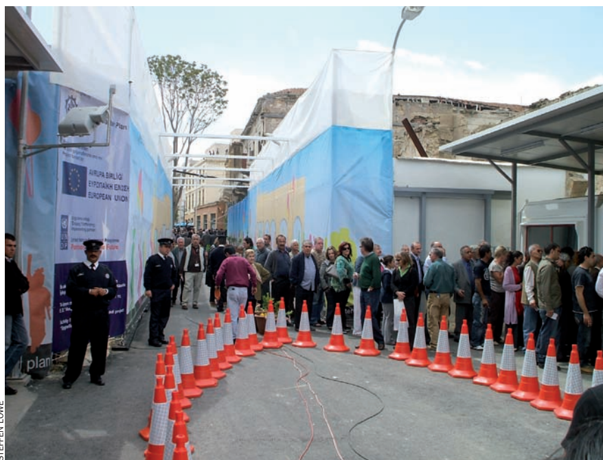
Un grup de grecoxipriotes fan cua per poder passar la barrera del carrer de Ledra, a Nicòsia, la capital de Xipre, l'abril del 2008, quan fou oberta i es va permetre el pas a l'una banda i a l'altra.

Per a molts grecoxipriotes la solució dels dos estats implicaria un reconeixement de facto de la partició de l'illa en lloc de reunificar-la. De fet, un dels principals esculls, ara per ara, és que Turquia no reconeix l'estat grec de Xipre, a la vegada que cap altre país del món, tret de Turquia mateix, no reconeix la República Turca de Xipre del