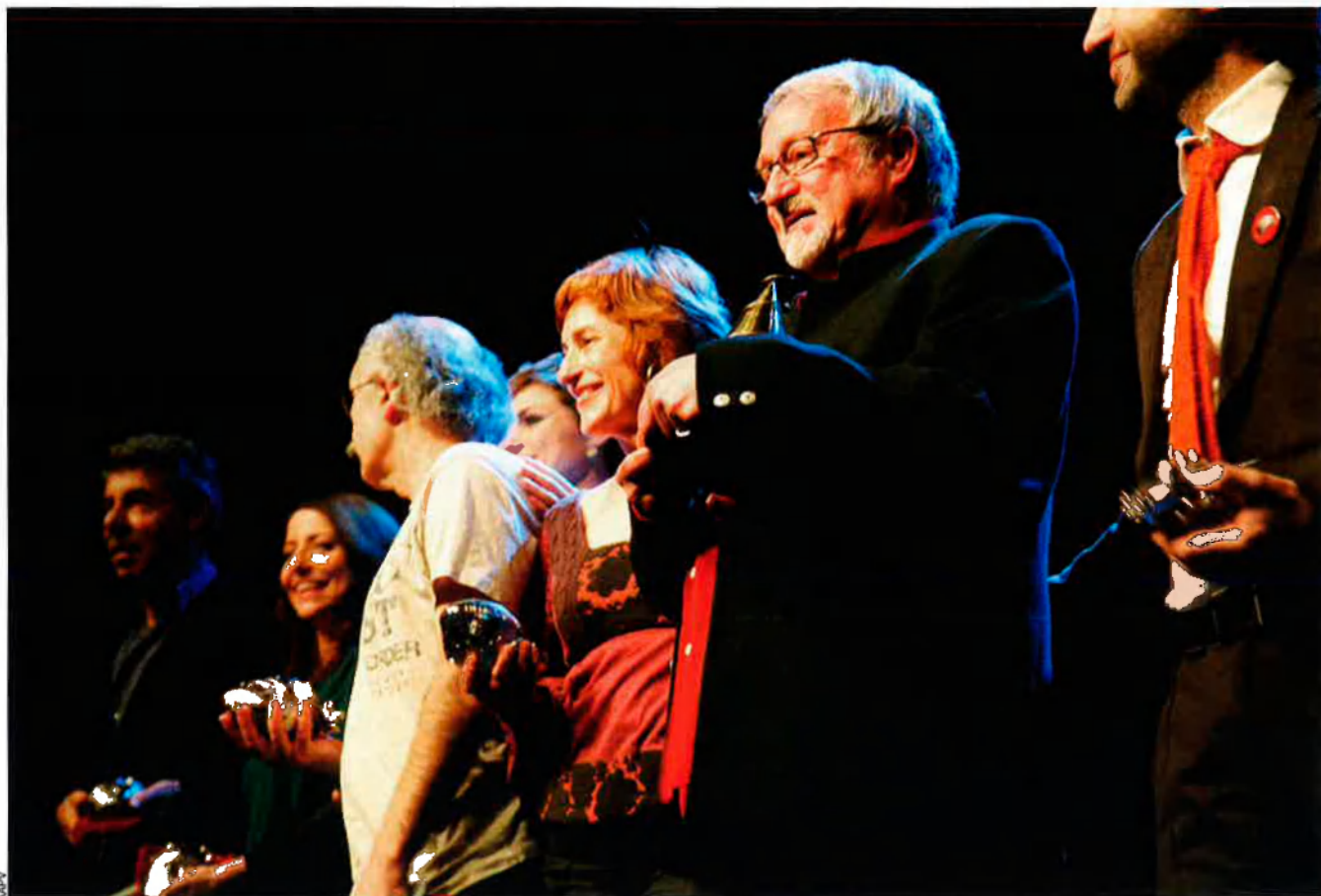
Una imatge d'alguns dels guardonats durant la gala de lliurament dels premis AAPV.