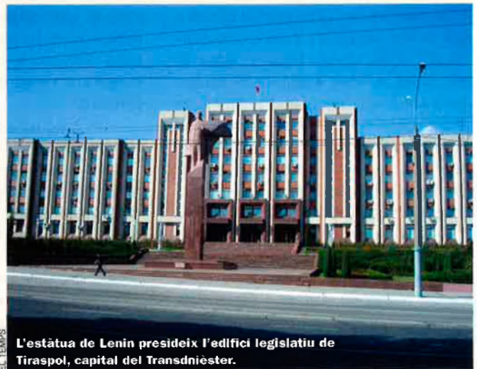
L'estàtua de Lenin presideix l'edifici legislatiu de Tiraspol, capital del Transdnièster.