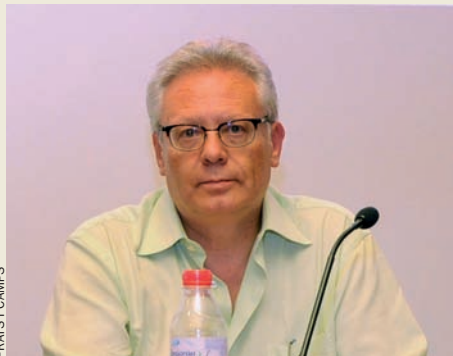
FRANCS I CAMPS

És possible que si es crea algun canal per aquesta via, tinga una certa audiència, però encara serà molt baixa. Per a fer una cosa digna, necessites una plantilla i uns recursos econòmics que per la via publicitària no arriben quan parlem d’internet com a suport. Es diu molt que internet serà el futur de la publicitat, però el percentatge de publicitat a internet continua essent molt baix. També és veritat que, tenint en compte la relació que els joves tenen amb internet, és possible que en el termini de deu anys o quinze hi haja un canvi molt substancial de com es mira i quina televisió és mira.